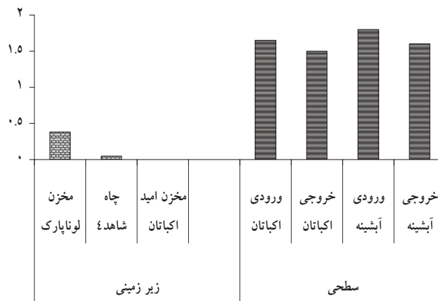
شکل ۲: حداکثر مقادیر اندازه گیری شده سم کلرپیریفوس (ppb) در منابع سطحی و زیر زمینی تامین آب شرب شهر همدان ماه (خرداد سال ۱۳۸۶)

بیشترین غلظت باقی مانده سم کلرپیریفوس در منابع آب سطحی به ترتیب مربوط به ایستگاه های ورودی تصفیه خانه آبشینه (۱/۸ppb)، ورودی تصفیه خانه اکباتان (۱/۶۵ppb)، خروجی تصفیه خانه آبشینه (۱/۶ppb) و خروجی تصفیه خانه اکباتان