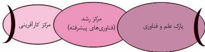
شکل ۳. کریدور علم و فناوری

کشورها (برای مثال آمریکای لاتین) به صورت هویت‌های کاملاً مستقل عمل کرده و توانایی انتقال فناوری را ندارند. برخی دیگر نیز (مانند آلمان) دارای ساختارهای علمی پژوهشی بسیار گران بودند، چرا که از محققان تمام وقت استفاده می‌کردند در صورتی که گزینه کاملاً متفاوت و ارزانی وجود دارد؛ استفاده از دانشجویان برای اهداف تحقیقاتی.