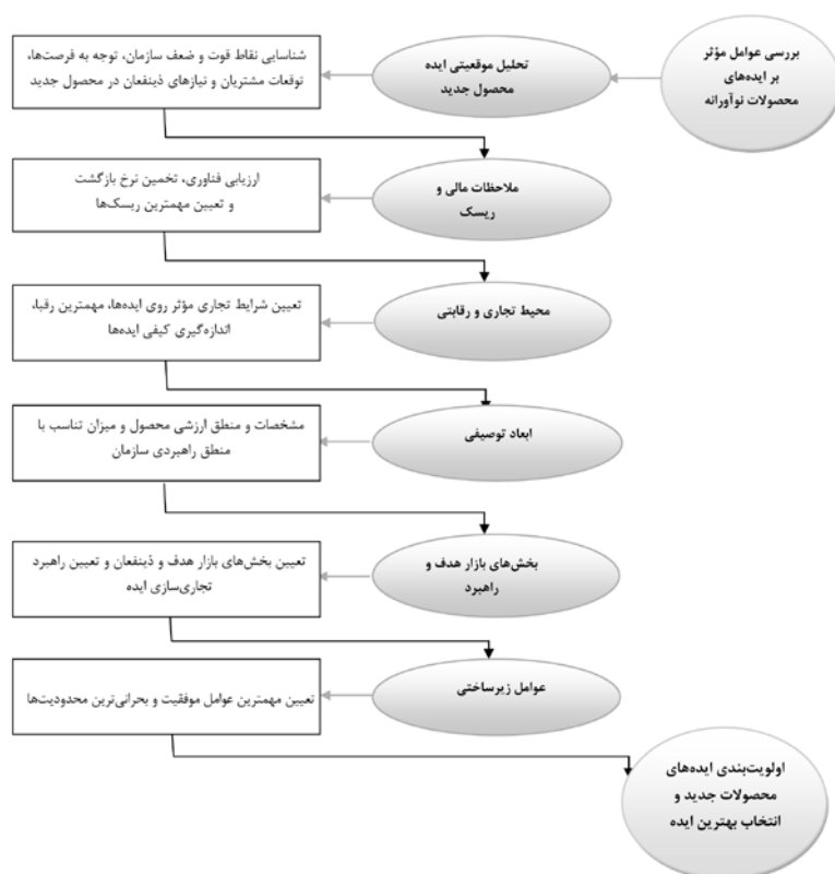
شکل ۶- مدل مفهومی انتخاب ایده‌های محصولات نوآورانه

ارائه چارچوبی مفهومی برای انتخاب ایده‌های محصول جدید و نوآورانه یاسر قاسمی‌نژاد، فرهاد شاه‌میری