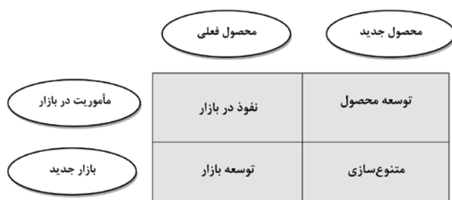
شکل ۲- مدل راهبرد رقابتی آنسف در توسعه محصول جدید [۳]

ارائه چارچوبی مفهومی برای انتخاب ایده‌های محصول جدید و نوآورانه یاسر قاسمی‌نژاد، فرهاد شاه‌میری