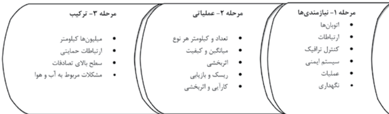
شکل ۵- مدل ساده‌ای از تحلیل زیرساخت فرایند تولید اتومبیل [۵]