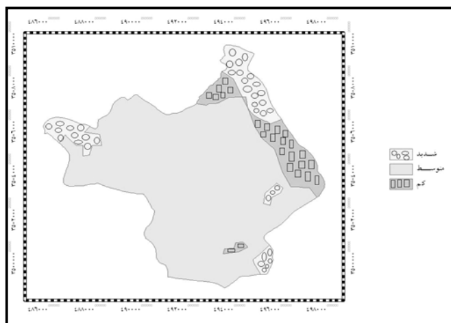
شکل ۳- نقشه شدت فرسایش در منطقه مورد بررسی