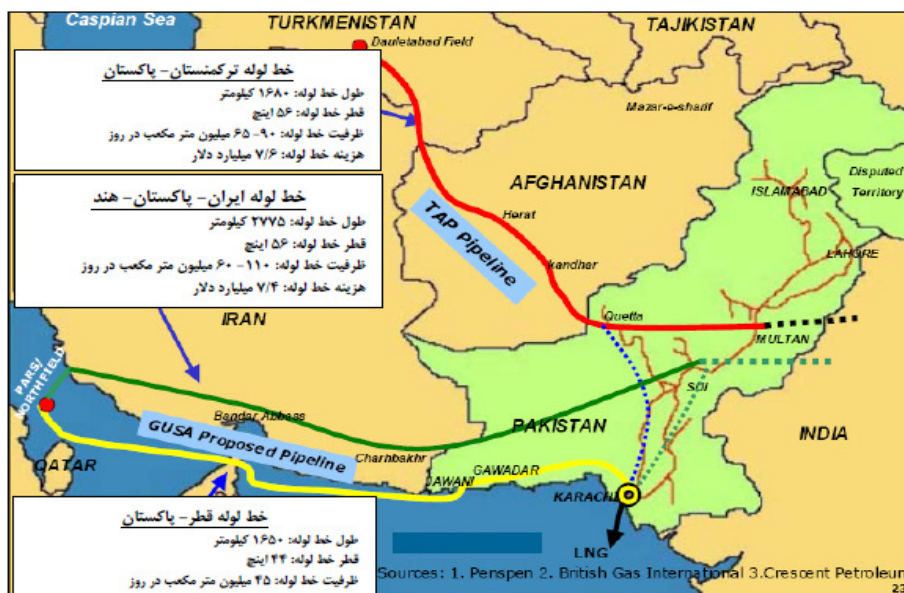
شکل ۱. مسیرهای احتمالی واردات گاز کشورهای هند و پاکستان