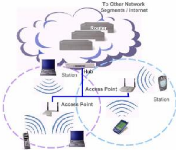
شکل 2. پیکربندی شبکه های مبتنی بر AP

ناحیه‌ای که توسط یک AP، تحت پوشش قرار می‌گیرد، سلول ۱ نامیده می‌شود. هر ایستگاه کاری در داخل یک سلول می‌تواند به AP دسترسی پیدا کند. وسعت ناحیه تحت پوشش یک AP متغیر است و به طراحی و ساخت AP، محیطی که در آن کار می‌کند و قدرت ارسال‌کنندگی آن، بستگی دارد (Drew 2006) (شکل 2).