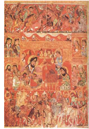
تصویر ۱: کتاب التریاق، مکتب سلجوقی قرن ۷ ه. ق.