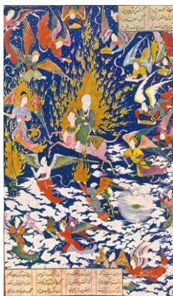
تصویر ۴: سلطان محمد، معراج پیامبر، خمسه شاه تهماسبی، مکتب تبریز، قرن ۱۰ ه. ق.