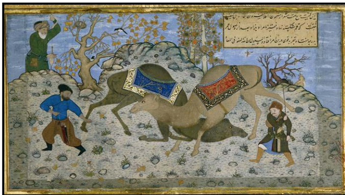
تصویر ۷. نزاع شتران، مرقع گلشن کمال الدین. بهزاد، هرات، حدود ۹۳۵ هـ ق)