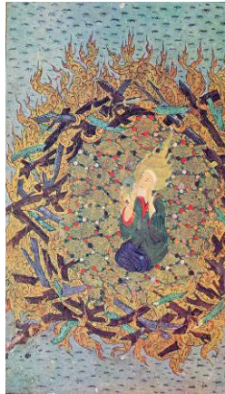
تصویر ۲: ابراهیم میان آتش مکتب شیراز، قرن ۸