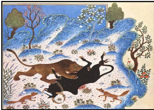
تصویر ۶. شیر در حال کشتن گاو، کلیله و دمنه شاهنامه بایسنقری، هرات، ۱۴۳۰

آورده اند. همچنین کیمیا وارد تصوف اسلامی شد و تا کنون نیز این تأثیر را در میان صوفیان دارد" [آرام ۱۳۶۶: ۴۷]. در واقع هنر نگارگری ایران در تجسم عالم ملکوت و ماهیت نورانی آن با استفاده از رنگهای ناب (ملهم از جوهره ی نورانی آنها)، و نیز، کاربرد طلا (با مفهوم کیمیایی آن) توانسته است، تصاویر نمادینی را بر مبنای مفاهیمی متعالی و معنایی خلق کند. نگارگر ایرانی توانسته است نور را بصورت تجسم آسمانهای طلایی که عالم سراسر نور خوارنه و حضور نور ایزدی را در جهان هستی نمایندگی می کند؛ هاله های نور طلایی رنگ دور سر قدیسیان، پیامبران و شهriاران کیانی که نشان از برخورداری انسانهای کامل از خوره شهریاری یا "فر ایزدی" خاص آنها می دهد؛ تجسم گرفت و گیر نیروهای خیر و شر، نور و ظلمت در قالب داستانهای حماسی (مانند نبرد بهرام گور و اژدها) (تصویر ۵) و یا بیان سمبلیک آن در قالب فرم های حیوانی (مانند گرفت و گیر شیر و گاو) (تصویر ۶) و فرم های گیاهی (مانند درختان خشکی ده و سر سبز) (تصویر ۷) به صورتی محسوس وارد دنیای تصویری نمادین خویش نماید.