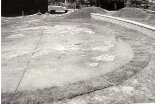
تصویر ۳. طرح مشارکتی کودکان با دانشجویان معماری برای نصب آثار هنری در حیاط دبستان (Sutton et al,2002)

یافتن به نیازهای واقعی کودک به عنوان استفاده کننده اصلی فضاست. در این خصوص با استناد به نظریات مشارکت استفاده کننده در فرایند طراحی، ورود کودکان به فرآیند طراحی و نظرسنجی از آنها به روش هایی چون نقاشی از محیط محله و تعامل مناسب آنان با کارگروه طراحی و ساخت و مداخله آنان در خلق فضای مناسب می تواند مورد توجه باشد. بدیهی است که مشارکت آگاهانه و علاقمندانه کودکان در خلق فضاهای باز محله مثل بوستان کودک، خلاقیت آنها را در تمام ابعاد برمی انگیزد و خود به ایجاد محیط خلاقانه تری منجر می شود و امکان حضور بیشتر و بهره برداری بهینه آنها را نیز به دنبال دارد.