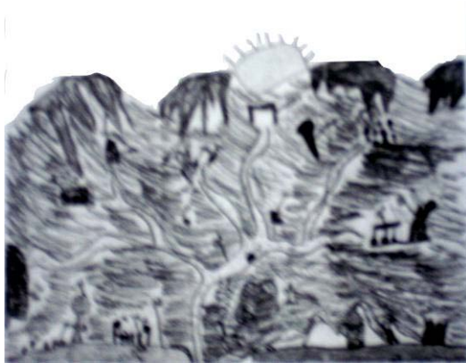
نقاشی یک کودک دبستانی سال چهارم از محله مسکونی مطلوب (Sutton et al, 2002)

بنابراین در صورت پدید آمدن شرایط مناسب، امکان پرورش خلاقیت در بسیاری از افراد فراهم می شود. در همین راستا می توان به دوران کودکی و نقش آن در پرورش خلاقیت نیز اشاره داشت، چرا که بدیهی است کودکی که در محیط نامساعد پرورش یافته از توان خلاقه کمتری برخوردار خواهد بود و عمده مشکلات افراد در زمینه خلاقیت ریشه در این دوران دارد. " [حسینی، ۱۳۷۶]