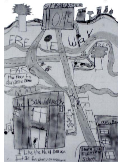
نقشه شناختی یک کودک دبستانی سال پنجم از محله مسکونی با خیابان های آسفالت (Sutton et al, 2002)

تماس مستقیم با محیط های بیرونی سالم یکی از ابعاد مهم رشد کودک محسوب می شود. در حالی که آموزش رسمی در فضاهای بسته صرفاً بخشی از حواس کودک را فعال می کند، یادگیری فعال در محیط های بیرونی نسبت به محیط های بسته، تمام ابعاد رشد کودک را برمی انگیزد. در نگرش های نوین آموزشی، تعلیم در فعل جستجو و کشف تفسیر می شود و لذا تلاش می شود محیط تعلیم و تربیت از امکانات، لوازم و انگیزه های کنجکاوی، تحقیق و کاوش سرشار شود به گونه ای که آموزش از فضای بسته کلاس های درسی به حیاط و به طور کلی فضای باز نیز گسترش یابد به گونه ای که فضای باز نیز واجد کارکردی اساسی چون کلاس تبدیل شود. بدیهی است که آموزش موضوعات محیطی نظیر حفظ سرمایه ها و میراث طبیعی و فرهنگی و تاریخی و آموزش مفاهیم شهروندی و مشارکت اجتماعی در بستر فضاهای باز شهری محلی نظیر بوستان، فضای بازی، فضاهای جمعی بسیار خلاقانه تر و مؤثرتر صورت خواهد گرفت.