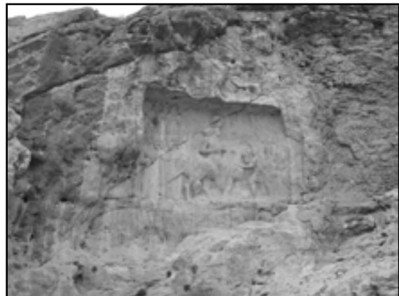
تصویر ۱. نقش برجسته شاپور اول - پادشاه ساسانی - در مجاورت شهر دارابگرد سیدین. ۱۳۸۷

به اعتقاد هوف این شهر که در ابتدا "رام و اشناسکان" نامیده می‌شد، [هوف، ۱۳۷۴: ۴۱۱] بارویی مثلثی شکل داشته؛ لیکن حجاج بن یوسف - که حاکم اموی ایالت پارس بود - در سال ۷۱۴ میلادی (اوایل قرن دوم هجری) حصار شهر را ویران و با الگو برداری از باروی گور، حصاری جدید و دایره شکل را بر گرد دارابگرد می‌سازد [هوف، ۱۳۶۵: ۱۸۰]. احتمالاً از این روست که ابن حوقل [۱۳۶۶: ۴۷] و جیهانی، باروی دارابگرد را جدید و مطابق حصار اردشیرخوره توصیف کرده‌اند [جیهانی، ۱۳۶۸: ۱۱۵].