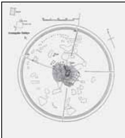
نقشه شماره ۱. نخستین نقشه تهیه شده از دارابگرد Morgan 2003

پیتر مورگان و دیتربیش هوف [۱۳۷۴ : ۴۱۴] عرض خندق را در قسمت دروازه غربی شهر حدود ۶۰ م نوشته اند. (Morgan, 2003: 6) آزما این اندازه را ۲۵ متر و عمق خندق را ۱۲ متر نوشته است. [آزما، ۱۳۷۰ : ۱۱۲] فرصت، ۷ - ۶ ذرع ۳۵ را برای عرض خندق ثبت نموده است. [فرصت شیرازی، ۱۳۷۷ : ۱۵۴] ظاهراً تا همین اواخر، روزها تخته پل هایی را برای تردد به شهر بر روی خندق می‌انداخته اند که شبها برای حفظ امنیت بیشتر جمع می گشت ۳۶ [آزما، ۱۳۷۰ : ۱۱۳]. (نقشه شماره ۱)