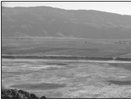
تصویر ۲. باروی شهر از فراز ارگ حکومتی کریمیان. ۱۳۸۷

شیرازی، ۱۳۷۷: ۱۵۳؛ جغرافیا و اسامی دهات کشور، ۱۳۲۹: ۲۹۰؛ حسینی فسایی، ۱۳۶۷: ۱۳۱۱] و میزان گردی آنرا به حدی قابل توجه یافته اند که ساخت آنرا به رسم دایره ای با پرگار تشبیه کرده‌اند [ابن بلخی ۱۳۷۴: ۳۰۹؛ مستوفی قزوینی ۱۳۶۲: ۱۳۹؛ حسینی فسایی ۱۳۶۷: ۱۳۱۱]. (تصویر ۲) منابع تاریخی طول این بارو را در حدود یک فرسخ یا شش کیلومتر، نوشته اند [جغرافیا و اسامی دهات کشور، ۱۳۲۹: ۲۹۰؛ حسینی فسایی، ۱۳۶۷: ۱۳۱۱؛ فرصت شیرازی، ۱۳۷۷: ۱۵۴؛ آزما، ۱۳۷۰: ۱۱۲]. در حالی که فرصت، ارتفاع بیرونی بارو را حدوداً پنج ذرع و ارتفاع درونی را تقریباً سه ذرع نوشته ۳۷ ؛ [فرصت شیرازی ۱۳۷۷: ۱۵۴] ابوت (Keith Abbot)، ارتفاع آنرا ۴۰ - ۳۵ پا و پریس (Preece) آنرا ۲۰ پا ۳۸ به حساب آورده است [شواتس ۱۳۷۲: ۱۳۰]. مورگان تنها فردی است که ارتفاع درونی بارو را ۱۰ متر درج و اندازه عرض پایه آنرا برابر با ۲۲ متر نگاهشته است. [Morgan, 2003: 6] در حالی که هوف قطر باروی دارابگرد را تقریباً با شهر اردشیرخوره برابر و حدود دو کیلومتر نوشته، [هوف، ۱۳۷۴: ۴۱۳] ابوت قطر باروی گور، و پریس قطر باروی دارابگرد را حدود یک میل ذکر کرده‌اند ۳۹ [شواتس، ۱۳۷۲: ۸۷]. ابن حوقل نیز وسعت دارابگرد را به اندازه اردشیرخوره و بیشاپور می‌داند [ابن حوقل، ۱۳۶۶: ۴۸].