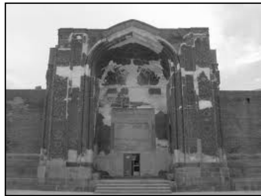
تصویر ۵. الف. مسجد کبود تبریز.

هر دو آثار را می‌توان جزء آثار جاودان به حساب آورد. اما آنچه موجب جاودانگی هر دوی اینها شده است، توجه به تمام ساحات معماری در طراحی و ساخت آنها است. اگر چه میزان توجه به این عوامل در هریک متفاوت است به طوری که اولی با گرایش غالب نخبه‌پسند و دومی با گرایش غالب عام‌پسند شکل گرفته است. لازم به ذکر است هر جامعه‌ای به هر دو نوع آثار احتیاج دارد.