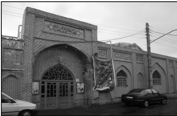
تصویر ۵. ب. مسجد مقصودیه تبریز.

در واقع بحران معماری امروز ناشی از کمبود خلاقیت نیست، بلکه از کمبود مبانی نظری ما نشأت می‌گیرد. مبانی که روزگاری قدرتمندانه در وجود ما ریشه داشت و اکنون بر اثر غفلت و ناسپاسی خود آنها را از دست داده‌ایم. در واقع آنچه ضامن بقا و جاودانگی این میراث تمدن معماری شده است، عدم اتکاء آفرینش‌های هنری، آفرینندگانشان و انتساب آن به خالق هستی‌بخش در کنار توجه متعادل به تمام ابعاد مطرح در معماری است.