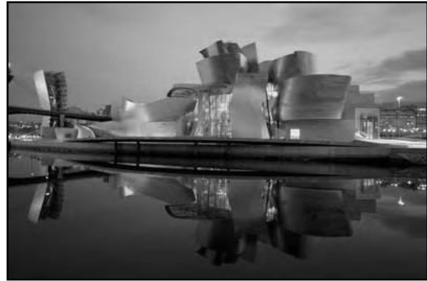
تصویر ۱. موزه گوگنهایم گری

در هر دو آثار می‌توان چیره‌گی خواست هنرمند بر جامعه، نیاز مردم و طبیعت را دید. گویی این آثار تنها در جهت معرفی خود و معمار خود ساخته شده است. در "جامعه وفور نعمت"، معماری حتی از منطق عمومی و کارکردی و... نیز فاصله می‌گیرد و نقش معیارهای وحدت بخش اجتماعی بسیار کم‌رنگ می‌شود.