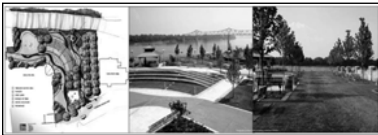
تصویر ۴. تبدیل کانسپت اولیه به فضای قابل استفاده برای تفریح در کنار روخانه اونسبرو (Owensboro)، ایالت کنتاکی (Kentucky)، آمریکا.