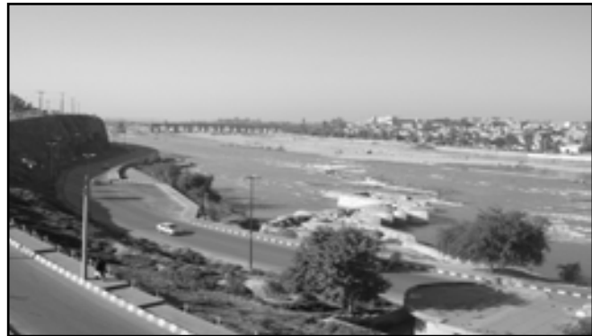
تصویر ۱. نمایی از کناره‌های بدون طراحی و آسیاب‌های در حال تخریب رودخانه دز - دزفول