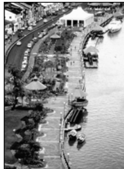
تصویر ۳. امکان پرسه زدن و حاکمیت پیاده در کنار رودخانه کوچینگ (Kuching) در ایالت ساراواک (Sarawak)، مالزی. مأخذ: John L.Lorg، ۲۰۰۶: ۲۴