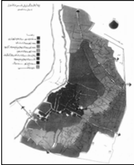
تصویر ۲. پیدایش و گسترش شهر دزفول در دوره‌های مختلف در کنار رود دز (رودخانه نوع اول). مأخذ: نعیم، ۱۳۷۶: ۷۱

۳.۳. رودخانه‌هایی که اخیراً در اثر رشد شهر، به عنوان یکی از عناصر موجود در شهر مطرح شده‌اند و عملاً هیچ‌گونه نقشی در شکل‌گیری‌های اصلی شهر نداشته‌اند، مانند؛ ساری، گرگان و همدان.