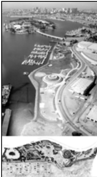
تصویر ۶. ایجاد محدوده امن برای شنا و قایقرانی و زنده و پویا کردن منطقه صنعتی کالیفرنیا و اُکلند با ایجاد یونیون پارک (Union Point Park).