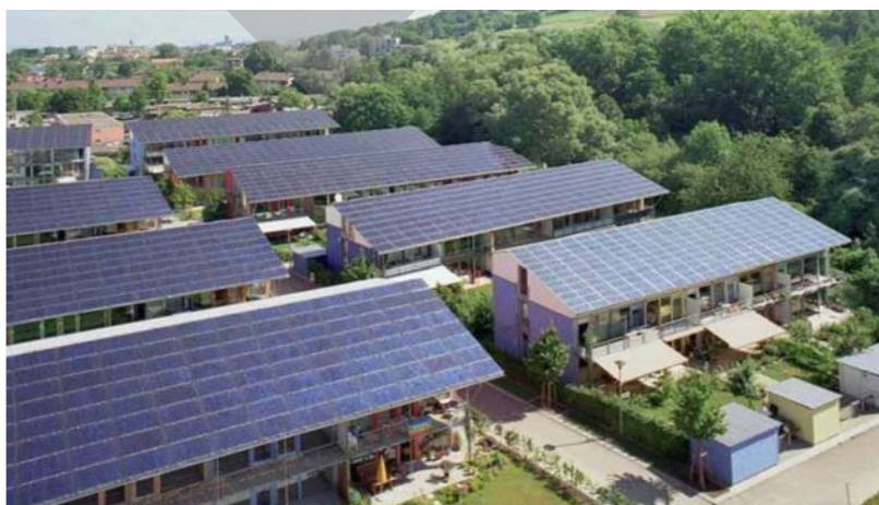
تصویر ۵. نمونه اجرا شده بوم‌شهر در فنلاند.