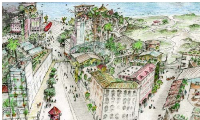
تصویر ۲. طرح از بوم‌شهر ترسیم شده توسط ریچارد رجیستر، مأخذ: Register, 2006: 57

به یک اندازه حق حیات دارند" (Register, 2006: 12). وی تعریف خود را به صورت طراحی شاکل مطلوب بوم‌شهر به تصویر می‌کشد. تصویر ۲ نمونه‌ای از این طرح‌ها است. رجیستر در مجموع شاخصه یک بوم‌شهر را در پانزده مورد بیان می‌کند که شامل دسترسی بر مبنای مجاورت، هوای تمیز، خاک سالم، آب سالم و تمیز، منابع و مواد پاسخگو، انرژی پاک و تجدیدپذیر، غذاهای سالم و در دسترس، فرهنگ سالم، ساخت ظرفیت‌های اجتماعی سالم و مشارکت، اقتصاد سالم و عادلانه، تحسیلات مادام‌العمر، کیفیت زندگی، تنوع زیستی سالم، ظرفیت برد زمین و یکپارچگی بوم‌شناسانه می‌شود (Ecocitybuilders, 2013). او برای هر یک از این شاخصه‌ها معیارهایی تعیین می‌کند. معیارهای مربوط به شاکل بوم‌شهر از دیدگاه رجیستر مستخرج از این شاخصه‌ها عبارتند از: - کاربری مختلط و اختلاطی از مسکن جمعی و خصوصی - بافت فشرده و مرکز محور به نحوی که بیشتر نیازها در فاصله قابل پیاده‌روی و دوچرخه‌سواری تأمین شود. - شاخص بودن شبکه‌های حمل و نقل پیاده، دوچرخه، ریلی و حمل و نقل عمومی در تمامی نقاط شهر - افق دید واضح و رنگ‌های شفاف در روزی آفتابی - آسفالت‌زدایی، برداشتن آسفالت از فضای عمومی به منظور جایگزین کردن فضای سبز، پارک و درخت - استفاده از شیوه‌های کاشت و گونه‌های گیاهی بومی، باغ‌سازی