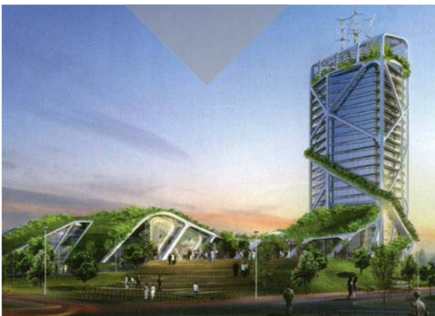
تصویر ۴. طرح از بوم‌شهر براساس ایده یانگ

از این دیدگاه پنج عامل برنامه‌ریزی در یک بوم‌شهر وجود دارند که شامل کالبد و چهار بخش توسعه شهری ساختار شهر، حمل و نقل، جریان مواد و انرژی و عوامل اقتصادی اجتماعی است. کالبد به محیط‌های طبیعی و مصنوعی اشاره دارد که تحت تأثیر شهر واقع شده‌اند و به کمک شهر به یکدیگر متصل شده و باعث ایجاد چارچوبی عمومی جهت درک عملکرد درونی شهر می‌شوند. ساختار شهری به واقعیت کالبدی شهر باز می‌گردد که به عنوان یک سامانه درونی در نظر گرفته و شامل تقاضای زمین، کاربری زمین، فضای سبز، افق دید، آسایش شهری، فضای عمومی و ساختمان‌هاست. شیوه‌های متعدد حرکت با سرعت کم، حمل و نقل عمومی، حمل و