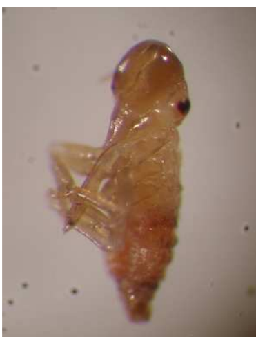
شکل (۳) پوره سن ۲ نسل اول - با بزرگنمایی ۴۰ برابر

پس از تولید کف، حشره در داخل کف حرکت کرده و از آن به عنوان محیط مرطوب و محافظت کننده استفاده می‌کند. برای اندازه گیری طول بدن از تعداد ۲۰ نمونه زنجره استفاده گردید. پوره‌های سن اول بعد از ۵۰/۶۶± روز پوست اندازی کردند و پوره‌های سن دوم ظاهر شدند. آنها نیز تولید کف کردند. این کف در پایین ترین بخش اندام‌های هوایی گیاه و نزدیک طوقه تشکیل شد. اندازه پوره‌های سن اول و دوم به ترتیب ۱۴/۱± و ۱/۱± میلی‌متر بود.