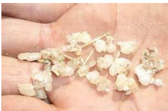
شکل (۶) مان ترنجبین جدا شده از شاخه در شهریور ماه

جدول (۱) میانگین (± خطای معیار) طول دوره نسل‌های مختلف زنجری. Poophilus nebulosus Leth (روز) و درجه حرارت و رطوبت مناسب برای ظهور زنجبرک در تربت جام در سال ۱۳۸۶