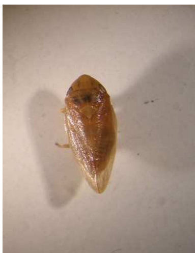
شکل (۴) حشره کامل زنجری Poophilus nebulosus Leth با بزرگنمایی ۱۶ برابر