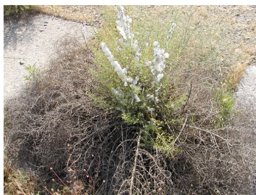
شکل (۱) فعالیت نسل اول روی بوته خارشتر به صورت تولید کف