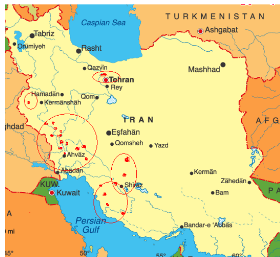
شکل (۱) پراکنش توده‌های بابونه آلمانی جمع آوری شده در این بررسی