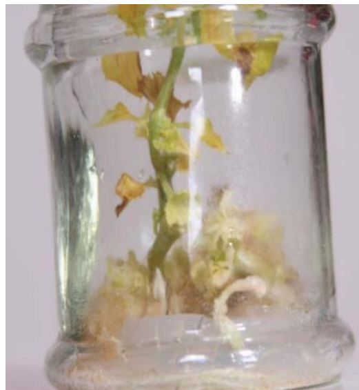
شکل ۳- القای گیاه کامل از کوتیلدون در حضور BA و NAA در ژنوتیپ گرگر