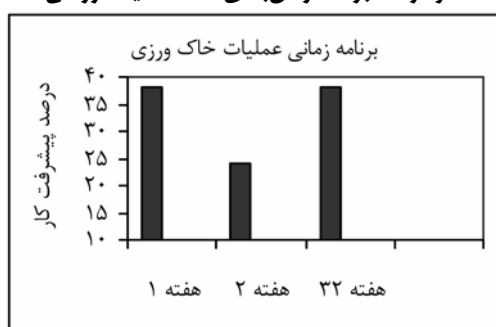
نمودار ۱- برنامه زمان‌بندی شده عملیات زراعی