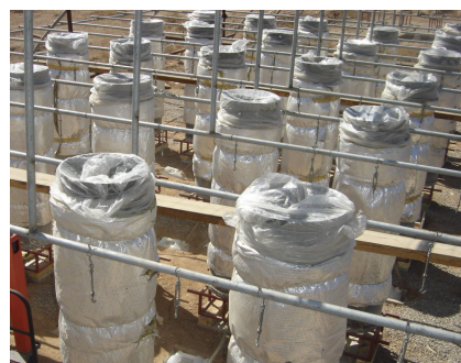
(تصویر ۲) - پوشاندن سطح خاک به وسیله کیسه پلاستیکی

روش های مختلفی برای اندازه گیری جرم مخصوص ظاهری خاک معرفی شده اند بلیک و هارت (۱) این روش ها عبارتند از تهیه نمونه دست نخورده لوتز (۴)، حفر چاله تیزدال (۸)، افشان کلوخه براشر و همکاران (۲) و روش های تشعشعی تیزدال (۸). ولی این روش ها مستلزم اخذ نمونه از اعماق مختلف خاک بوده و منجر به به هم خوردن شرایط یکنواخت حاصله خواهد شد. در نتیجه به ناچار از روش های غیر مستقیم برای ارزیابی صحت روش معرفی شده استفاده گردید. برای معیار اول فرض بر این است که اگر فرآیند پر کردن ستون در عمق و عرض یکنواخت صورت گرفته باشد از ایجاد جریان در لبه ستون جلوگیری شده و در نتیجه جریان ترجیحی از این مکان صورت