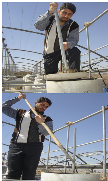
(تصویر ۱) - نمایی از نحوه کوبیدن (الف) و خراش دادن (ب) سطح خاک

کناره های ستون کاملاً به وسیله نوک میله کوبیده می شود تا از اثر حاشیه ای جلوگیری شود.