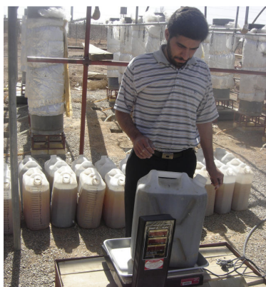
(تصویر ۳) - نحوه توزین زهکش جمع آوری شده پس از آبیاری

با توجه به اینکه در هر بار اندازه گیری زهکش‌ها علاوه بر توزین وزن زهکش خارج شده، شوری آن نیز برای تمامی زهکش‌ها به وسیله شوری سنج قابل حمل اندازه گیری می‌شد، پس این امکان وجود داشت که مشابه منحنی های رخنه تغییرات شوری زهکش خروجی در مقابل تعداد حجم منفذ زهکش خارج شده رسم گردد. هر چند در این نوع آزمایش امکان برقراری دقیق تمام پیش شرط‌ها مانند جریان اشباع ماندگار وجود نداشت ولی به دلیل اینکه آزمایش در اواخر فصل زمستان انجام می‌شد که در آن تبخیر محدود بود و نیز آبیاری همه روزه انجام می‌شد بنابراین با تقریب قابل قبولی احتمالاً می‌توان منحنی های به دست آمده را منحنی های رخنه خاک مورد استفاده نامید. هر چند در این زمینه ملاک روند تغییرات بوده است و نه مقادیر مطلق آن‌ها که ممکن است در سایر مطالعات اهمیت داشته باشد.