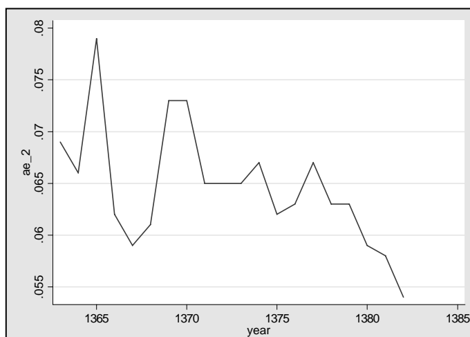
نمودار ۴: روند نابرابری در مناطق روستایی با استفاده از شاخص آتکینسن

در نمودار شماره ۴ روند نابرابری با استفاده از شاخص آتکینسن در دامنه معنی‌دار نشان داده شده است. در این نمودار بیشترین سطح نابرابری طی دوره ۸۳-۱۳۶۳ در سال‌های ۷۰، ۶۹، ۶۵ و کمترین سطح نابرابری در سال‌های ۸۲، ۸۱ دیده شده است