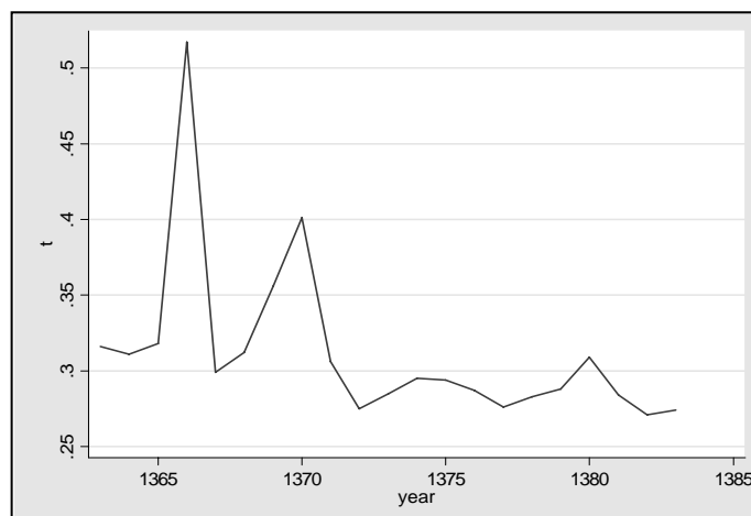
نمودار ۲: روند نابرابری در مناطق شهری با استفاده از شاخص تایل

در نمودار شماره ۳ روند نابرابری طی سال‌های ۸۳-۱۳۶۳ در مناطق شهری خلاصه شده است. در سال‌های ۶۵، ۷۰، ۶۶ به ترتیب بیشترین سطح نابرابری و در سال‌های ۸۳ و ۸۲ به ترتیب کمترین سطح‌های نابرابری دیده شده است. نتایج حاصل از برآورد شاخص آتکینسن طی سال‌های ۸۲-۱۳۶۳ در مناطق روستایی با استفاده از \epsilon (۱/۵، ۲/۷، ۳/۰، ۴/۰، ۵/۲) در جدول شماره ۲ خلاصه شده است. در 0 < \epsilon < 1 در روند نابرابری (مناطق روستایی) طی سال‌های ۸۲-۱۳۶۳ سازگاری وجود دارد. هرچه مقدار \epsilon بیشتر می‌شود مانند مناطق شهری، این سازگاری کمتر می‌گردد و روند نابرابری در \epsilon های بالاتر با هم متفاوت است. در جدول شماره ۲ نتایج حاصل از برآورد شاخص تایل و ضریب جینی در مناطق روستایی طی سال‌های ۸۲-۱۳۶۳ خلاصه شده است.