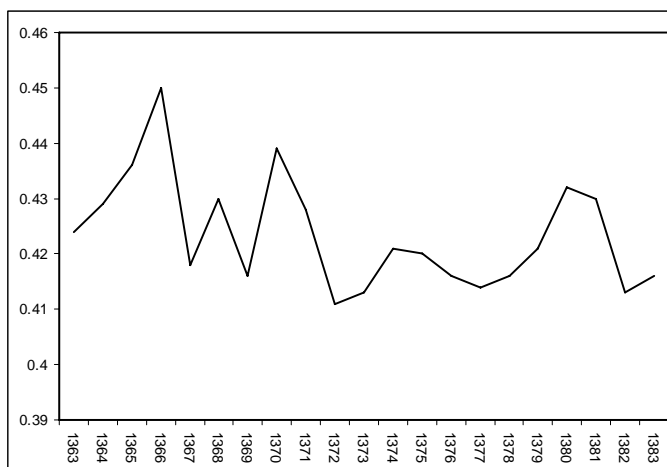
نمودار ۳: روند نابرابری در مناطق شهری با استفاده از ضریب جینی

در نمودار شماره ۴ روند نابرابری با استفاده از شاخص آتکینسن در دامنه معنی‌دار نشان داده شده است. در این نمودار بیشترین سطح نابرابری طی دوره ۸۳-۱۳۶۳ در سال‌های ۷۰، ۶۹، ۶۵ و کمترین سطح نابرابری در سال‌های ۸۲، ۸۱ دیده شده است