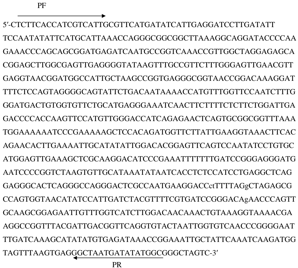
شکل ۴- قسمتی از ژن مشابه PDR5 جداسازی شده از گندم. ( آغازگرهای PR و PF با فلش مشخص شده‌اند)