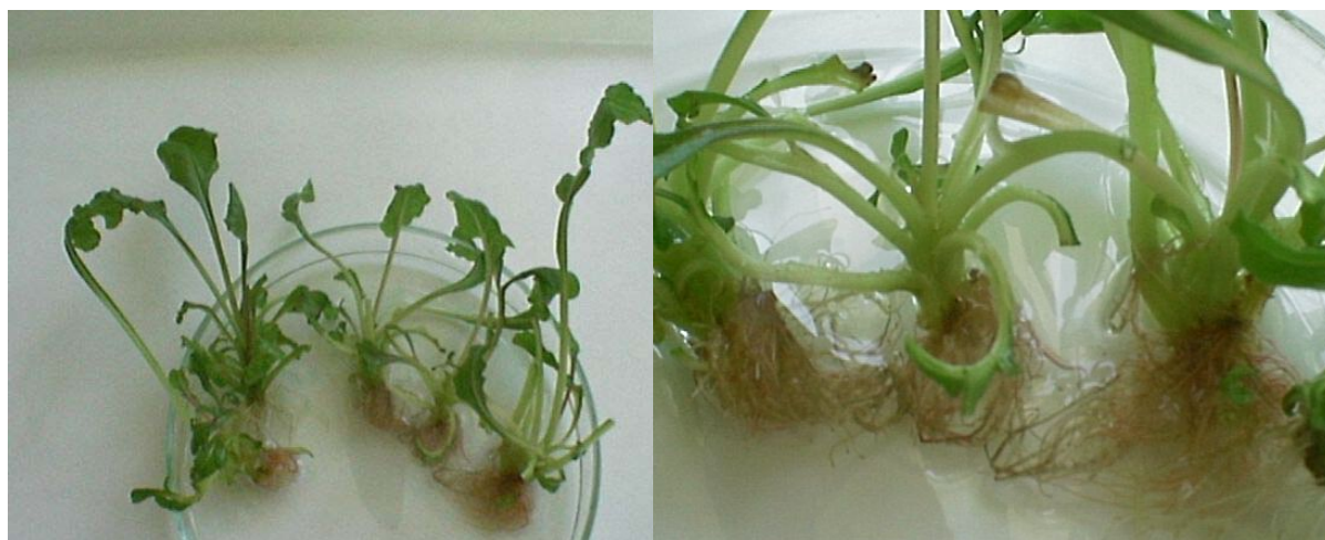
شکل ۳ ریشه‌زایی شاخه‌های چغندرقد در بیوراکتور

نتایج خلاصه شده در جدول ۲ بیان‌گر وجود اختلاف معنی‌دار بین سیستم بیوراکتور و ظروف ۱۰۰ میلی‌لیتری از حیث تمامی فاکتورهای مورد بررسی می‌باشد. علیرغم ریشه‌زایی برخی شاخه‌ها در بیوراکتور (شکل ۳)، نتایج حاصل از اعمال تیمار ریشه‌زایی در