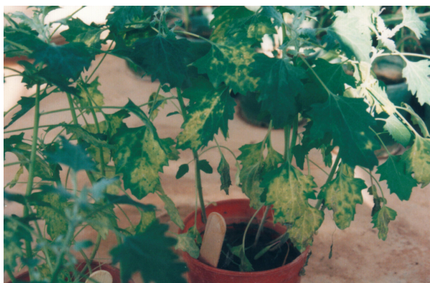
شکل ۲ توسعه لکه‌های موضعی و زردی در رگبرگ‌های C. quinoa ، پس از سپری شدن ۱۴ روز از زمان مایه‌زنی