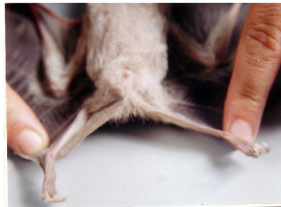
شکل ۴- پرده میان‌رانی، خیلی کم رشد کرده و دارای دم خیلی کوتاه می‌باشد

پرده میان رانی خیلی کم رشد کرده و به صورت حاشیه باریکی در قسمت داخل پاها و ران‌ها قرار دارد (شکل ۴).