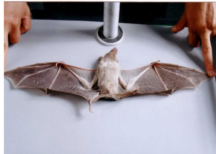
شکل ۳- سطح شکمی

بین سر و بدن تشکیل می‌دهد. فاصله بین نوک بال‌ها ۴۵ سانتی‌متر است (شکل ۳).