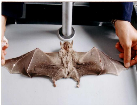
شکل ۵- سطح پشتی

دم خیلی کوتاه است و از زیر پرده میان‌رانی در حدود ۵ یا شش میلی‌متر بیرون می‌آید. موهای بدن به طور کلی زیاد بلند نیستند. روتنه و بازوها و نیمه قاعده‌ای ساعد به طور کلی از مو پوشیده شده و در نیمه انتهایی ساعد به تدریج موها کم می‌شوند. سطح پشتی پا، تا بالای پاشنه و همچنین قسمت‌هایی از پرده میان رانی که به بدن نزدیکتر است تا حدی از مو پوشیده شده است (شکل ۵).