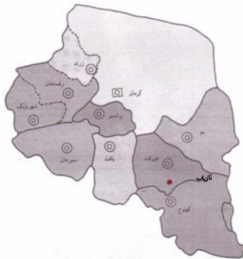
نقشه ۱- نقشه پراکندگی Rousettus aegyptiacus در کرمان

از تمام گونه‌های جمع‌آوری شده، گونه Rousettus aegyptiacus از استان کرمان جدیداً گزارش می‌شود. محل زندگی آن در کوه‌های اطراف روستای هور پاسفید در منطقه فاریاب جیرفت در ۳۷۰ کیلومتری جنوب کرمان می‌باشد. نقشه شماره ۱.