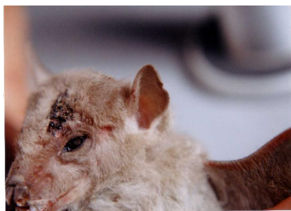
شکل ۲- گوش حلقه‌ای شکل

پوزه بدون مو و پوست آن کمی سیاه‌رنگ است. در دو طرف لب‌ها تعدادی موهای نسبتاً بلند وجود دارد. گردن رشد کرده و حد فاصل مشخصی