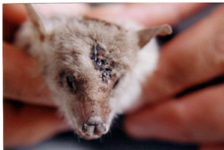
شکل ۱- صورت دارای پوزه دراز و سگ مانند که تیر خورده است

در خفاش میوه‌خوار سر نسبتاً بزرگ و پوزه دراز و پهن و ساده و به طور کلی سر به شکل سرسگ است. چشم‌ها نسبتاً درشت و لاله گوش با اندازه متوسط و به شکل ساده و حلقه‌ای شکل است (شکل ۱ و ۲).