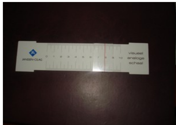
شکل ۴: خط کش VAS

در روش دوم جهت اندازه‌گیری زاویه‌ی قوس طولی کف پا در حالت متحمل وزن خط بین تکمه‌ی ناویکولار (Navicular) و مرکز قوزک داخلی و خط بین تکمه‌ی ناویکولار و سر استخوان متاتارس (Metatarsal) اول پا کشیده شد و زاویه‌ی بین این دو خط با گونیومتر (Goniometer) اندازه‌گیری شد. در صورتی که این زاویه کمتر از ۱۴۱ درجه باشد، زاویه‌ی پروناسیون پا افزایش یافته تلقی می‌شود. برای ارزیابی شدت درد از خط کش VAS استفاده شد که میزان شدت درد آخرین فعالیت ورزشی روی این خط علامت‌گذاری می‌شد. روی خط کش یک خط افقی ۱۰ سانتی متری وجود داشت که انتهای چپ این خط مربوط به عدم وجود درد و انتهای دیگر آن مربوط به شدیدترین دردی بود که فرد تجربه کرده بود. شدت دردی که فرد در طول آخرین فعالیت ورزشی خود احساس کرده بود به صورت علامت بر روی این خط مشخص می‌شد. فاصله‌ی بین سمت چپ خط و علامت گذاشته شده به سانتی‌متر حساب می‌شد و با عنوان شدت درد ثبت می‌گردید.