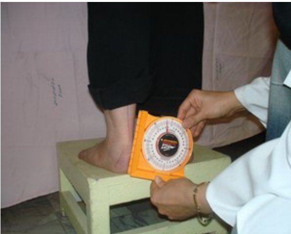
شکل ۲: روش اندازه‌گیری زاویه‌ی پروناسیون پا با انحراف سنج