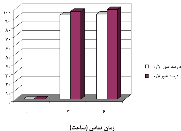
شکل ۲: مقایسه قابلیت میکروب‌کشی نورخورشید در ظروف با شفافیت متفاوت

در اینجا هم با توجه به نوع ظرف کارایی خوبی حاصل شده است هرچند که در مقایسه با سایر روش‌های گندزدایی زمان زیادی لازم است. کاهش در تعداد کلیفرمها (%)