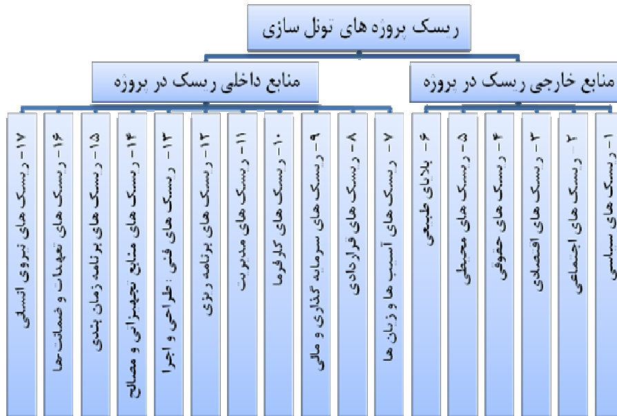
شکل ۱. ساختار شکست ریسک پروژه‌های تونل‌سازی (۱۷ ریسک اصلی)