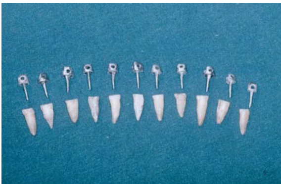
تصویر ۱. نشان دادن پست کورهای ریختگی

عدد جهت جانشین (خراب شدن احتمالی حین مراحل کار) انتخاب شدند. پس از ارزیابی رادیوگرافی دندانها، تاج آنها در ۳ میلیمتری بالای (Cemento Enamel Junction, CEJ) توسط دیسک قطع گردید و بعد از آماده سازی کانال، دندانها توسط گوتاپرکا و سیلر زینک اکساید اوژنول (با نام تجاری AH26) معالجه ریشه گردیدند. پس از درمان ریشه میانگین ۲/۳ طول ریشه ها محاسبه و کانال به طول ۱۲ میلیمتر توسط پیژوریمر شماره ۴۰۳ خالی گردید. پس از آماده سازی کانال، میله پلاستیکی منطبق با طول و قطر کانال آماده شد و سپس کانال دندانها تمیز و خشک و سطح داخل با وازلین چرب گردید. پودر و مایع آکریل دورالی، مخلوط با روش براش پستههای آکریلی ساخته شد و سپس قسمت Core فرم داده شد، در فاصله ۲ میلیمتری لبه انسیزال سوراخی به قطر ۲ میلیمتر جهت آزمایش کشش تعبیه گردید و نهایتاً الگوهای پست آکریلی اسپروگذاری و Investment با گچ ریختگی فسفات باند با نام تجاری Aurovest انجام شد. سپس عملیات ریخته گری با استفاده از آلیاژ Super cast طبق دستور کارخانه سازنده انجام شد و پستهها از سیلندرها خارج و با سندبلاست محتوی آلومینای ۵۰ میکرونی، تمیز شدند و بعد از قطع اسپرو، هر یک در دندانهای مربوطه امتحان شدند (تصویر ۱). بعد از این مرحله، جهت آزمایش کششی لازم بود ریشه دندانها شیار دار شده و در داخل سیلندر به قطر ۱/۵ و ارتفاع ۲/۵ سانتیمتری درون آکریل مدفون شود. رزین مورد استفاده در این مطالعه آکریل سرماسخت (آکروپارس - ایران) بود. بعد از قرار دادن دندانها در آکریل، توسط مواد مختلف شستشو دهنده، داخل کانالها شستشو داده شد که از این جهت دندانها به چهار گروه بیست تایی تقسیم شدند.