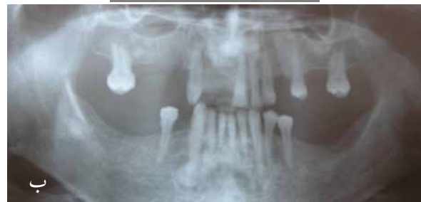
تصویر ۲: الف) در کلیشه رادیوگرافی پری آپیکال در ناحیه دندان کانین سمت چپ بالا آپسیتیه منتشر مشاهده می‌شود. ب) در کلیشه پانورامیک رادیوآپسیتیه‌های هموزن متعدد با حدود مشخص و همراه با ریم لوسنت در نواحی مختلف فک پایین و فک بالا مشاهده می‌شود.