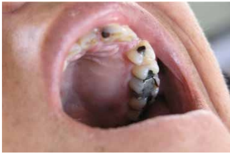
تصویر ۳: Expansion با قوام سخت استخوانی در محاذات ریشه دندان‌های پره مولر اول تا مولر دوم سمت چپ فک فوقانی