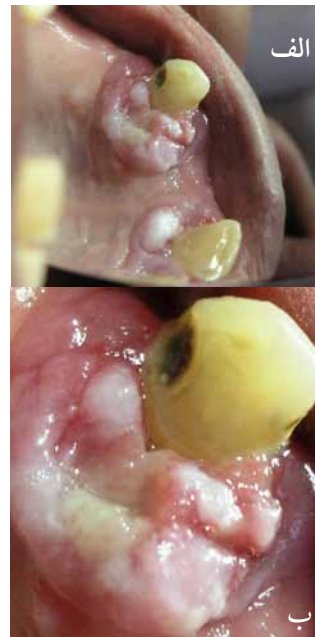
تصویر ۱: الف) ضایعه برجسته در مجاورت دندان‌های کانین سمت چپ و ثنایای مرکزی سمت راست که در ناحیه دندان کانین هم به باکال و هم به پالاتال گسترش یافته است. ب) ضایعه برجسته در مجاورت دندان ثنایای مرکزی فقط در پالاتال وجود دارد.