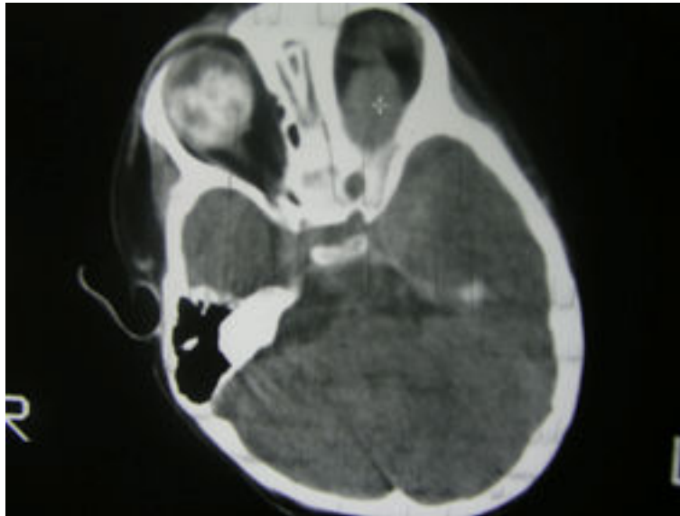
تصویر ۱: CT-Scan بدون تزریق مغز در CT-Scan تصویر ۱ وجود توده در اوربیت چپ و نیز وجود کلسیفیکاسیون داخل اوربیت خصوصاً در سمت راست مشهود است.

تشخیص نهایی با توجه به یافته‌های اختصاصی در CT-Scan بیمار و عدم وجود هیچگونه متاستاز در سایر نقاط بدن، پس از بررسی‌های انجام شده، Trilateral Retinoblastoma اعلام شد.