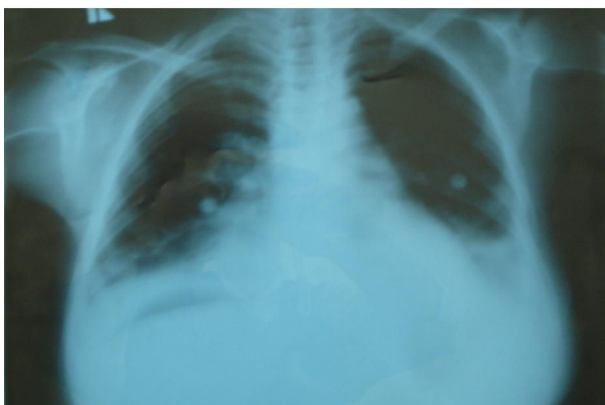
تصویر ۲: رادیوگرافی انجام شده از قفسه سینه، پلورال افیوژن دو طرفه را نشان داد.