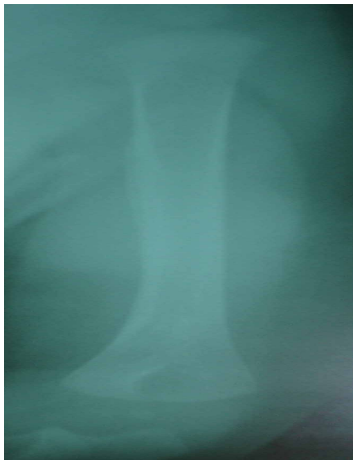
تصویر ۱: در رادیوگرافی بعمل آمده در استخوان هوموروس سمت راست (محل تلقیح واکسن) استئومیلیت واضح مشهود است.

ایمنوگلوبولین‌های مختلف، آزمایش CDهای مختلف، تست NBT، DHR، و کشت قرار گرفت و با تشخیص سل منتشر ناشی از مایکوباکتریوم بویس ترخیص شد. بیمار قبل از مراجعه به تهران با تشخیص سل منتشر ناشی از مایکوباکتریوم بویس متعاقب واکسن تحت درمان قرار گرفت که این تشخیص در مرکز طبی کودکان هم تایید گردید. نتایج تمام بررسی‌های نقص ایمنی که در مرکز طبی کودکان برای بیمار انجام شده بود طبیعی بود. در گرافی قفسه‌سینه علائمی به نفع درگیری ریوی وجود نداشت. بیمار تحت درمان با ایزونیازید، ریفامپین و کلاریترومایسین قرار گرفت که بهبودی واضح بعد از ۲۰ روز دیده نشد اما با اضافه نمودن گاما اینترفرون سیر بهبودی بیمار تسریع شد و در عرض حدود ۱۰ روز بهبودی واضح در زخم بیمار مشاهده شد، ترشحات سینوس‌ها اکثراً خشک شدند و لنف آدنیت قسمت گردنی تقریباً بهبودی کامل پیدا کرد.