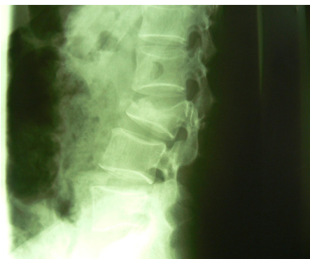
شکل شماره (۱)

در مرحله دوم با اصلاح مسیر و تعیین محل ورود پیچ ها، فقط ۱۰ پیچ (۱۵/۵٪) جاگذاری مناسب نداشتند که از این ۱۰ پیچ، ۴ پیچ در مهره L 2 از ۶/۵×۴۰° به ۶/۵×۴۵° و در مهره T 11 ۶ پیچ از ۴/۵×۴۰° به ۵/۵×۴۵° تبدیل و اصلاح مسیر داده شده است (۶ عدد در سمت چپ و ۴ عدد در سمت راست بوده است) در حین عمل جراحی هیچ گونه عارضه ای از قبیل پارگی دورمر، لیک csf و خونریزی وسیع وجود نداشته در فالوآپ ۶ ماه تا ۳ سال بیماران از پیچ های گذاشته شده ۳ مورد وضع نسبتاً مناسب نداشتند (۱/۶٪) و فقط یک مورد عفونت سطحی در محل انسزیون وجود داشته و عارضه دیگری وجود نداشته است.