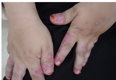
تصاویر (۱): پلاک‌های اریتماتو پوسته‌دار در نواحی انگشتان و گوش و صورت کودک مبتلا به لوپوس اریتماتو دیسکوئید

نوع دیسکوئید فرم شایع بیماری است که معمولاً در ناحیه گونه‌ها و گوش و بینی و کنار گردن و اسکالپ دیده می‌شود. ضایعه ممکن است دو طرفه بوده ولی لزوماً قرنیه نمی‌باشد. ریزش مو در یک سوم بیماران دیده می‌شود. ضایعات معمولاً به شکل پیچ‌های با اندازه‌های متفاوت و اریتماتو با دیواره مشخص به همراه پوسته دیده می‌شود. گاهی ضایعه به شکل پلاک صاف آنولار با مرکز مسطح می‌باشد. معمولاً برخی از ضایعات در عرض چند ماه خود به خود بهبود می‌یابند. آتروفی و اسکار از عوارض طولانی مدت بیماری تلقی می‌گردند. اشکال بالینی با شیوع کمتر شامل ضایعات آکنه ای فرم، روزاسه فرم، نوع متورم و فرم منتشر و فرم گرفتاری انگشتان دست می‌باشد. گرفتاری مخاط در 24\% موارد دیده می‌شود. تغییرات ناخنی به شکل هیپرکراتوز زیر ناخن، تغییر رنگ ناخن‌ها به قرمز - آبی و خطوط طولی در ناخن می‌باشد (۲).