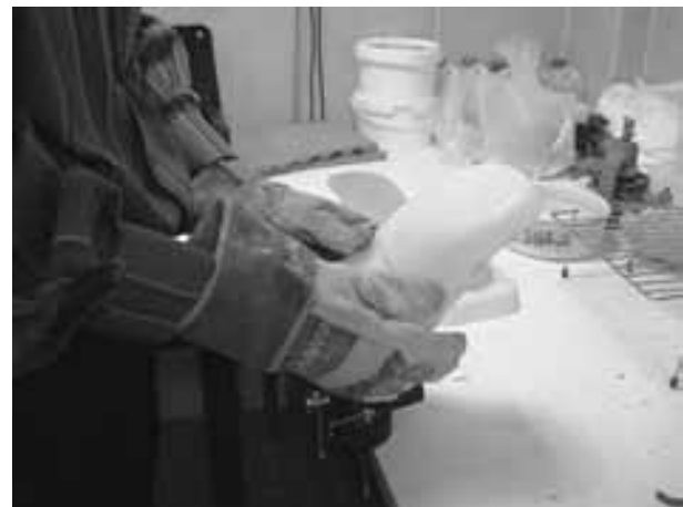
تصویر ۲: تصویر سمت راست مربوط به مرحله قالبگیری جهت ساخت ارتز عملکردی می‌باشد. تصویر سمت چپ مرحله کشیدن و شکل دادن ارتز عملکردی روی قالب تهیه شده از بیمار می‌باشد.