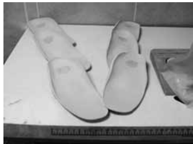
تصویر ۱: در تصویر سمت راست ارتز اصلاح شده و در سمت چپ ارتز اصلاح شده در حین تنظیم برای بیمار