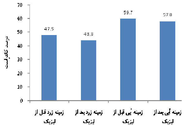
نمودار ۲- آستانه حساسیت کانتراست رنگی قبل و پس از عمل لیزیک در فرکانس فضایی ۳ دور بر درجه

با در نظر گرفتن این پارامترها تلاش شد تا ارزیابی مناسبی از تغییرات اپتیکی ایجاد شده در چشم پس از عمل جراحی انکساری به کمک لیزر (لیزیک) انجام شود. نتایج بدست آمده حاکی از آن است که حساسیت کانتراست رنگی پس از عمل جراحی انکساری به کمک لیزر (لیزیک) در مقایسه با تصحیح انکساری بیمار با عینک، شرایط بهتری را در عمل جراحی انکساری به کمک لیزر (لیزیک) می توان مشاهده کرد. مطالعات متعددی نشان می دهند که تغییر شکل قرنیه در