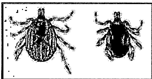
تصویر ۲: کنه هیالوما آناتولیکوم

واکسیناسیون و استفاده از ترکیبات کنه‌کش می‌باشد. واکسن‌ها از سویه‌های تخفیف حدت یافته و از شیزونت زنده انگل که بر روی سلول‌های لنفوییدی کشت داده شده تهیه می‌گردد. در ایران تنها از یک سویه تخفیف حدت یافته تیلریا آنولاتا به نام سویه SA برای واکسیناسیون استفاده می‌شود که بطور سالانه تزریق می‌گردد (۱ و ۴). با توجه به اینکه در استان سیستان و بلوچستان درباره تیلریوز گاوی اطلاعاتی وجود ندارد و با توجه به اهمیت بیماری این بررسی با هدف تعیین فراوانی آلودگی تیلریوز گاوی در شهرستان زاهدان و بررسی عوامل مؤثر در فراوانی آلودگی در طی چهار فصل در سال ۱۳۸۲ انجام گرفت.