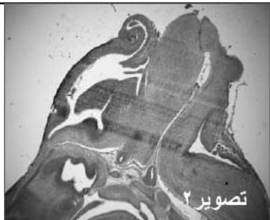
شکل ۲- فتومیکروگراف مغزدر برش طولی جنین گروه تجربی ۱

آسیکلوویر از جفت عبور می‌کند و به جنین می‌رسد (۲۳) و توان تراژونیک دارد و بیشتر بی‌نظمی‌های کلی ساختاری، مربوط به جمجمه و دم است (۲۱). ما نیز به یک مورد جنین در حال تحلیل در رحم که دلیل بر متوقف شدن رشدونمو در مراحل اولیه جنینی و یک مورد اگزینسفالی که دارای فتق نافی نیز بود، از کل ۸ جنین بدست آمده از گروه تجربی ۱ برخورد کردیم. این مطالعه نشان داد که اگر آسیکلوویر موضعی از طریق لیسیدن وارد بدن شود، مانعی برای رشد و نمو طبیعی جنین خواهد بود و احتمالاً باعث سقط جنین می‌شود، در حالی که مصرف آن در قسمت‌های دیگر پوست (به غیر از اطراف دهان) مشکلی بوجود نمی‌آورد و جنین‌ها بدون ناهنجاری به رشد ونمو خود ادامه می‌دهند. بیا توجه به یافته‌های این مطالعه توصیه می‌شود مادران باردار مبتلا به تبخال و عفونتهای مشابه ویروسی در صورت امکان در دو ماهه اول حاملگی که در طی آن جنین اندام‌زایی می‌کند، از این دارو لاقط در اطراف دهان استفاده نکنند، چون احتمال وارد شدن دارو به داخل دهان وجود دارد.