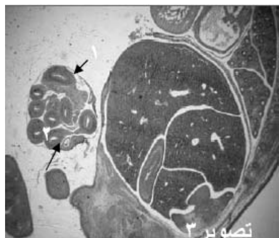
شکل ۳- فتومیکروگراف سطح شکمی جنین در گروه تجربی ۱ (۱- فتق نافی، ۲- لوپ های روده)