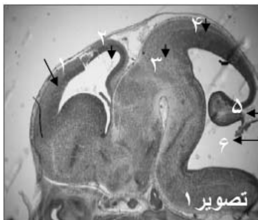
شکل ۱- فتومیکروگراف مغز در برش طولی جنین گروه شاهد (۱- کورتکس اولیه، ۲- بطن‌های طرفی، ۳- دین سفالن، ۴- مزن سفالن، ۵- متن سفالن، ۶- بطن چهارم)

ظاهر رحم در گروه تجربی ۱ بسیار متورم و تقریباً پر خون بود و طول شاخ رحم آن نیز کاهش داشت. در حالی که در گروه تجربی ۲ در مقایسه با گروه شاهد تفاوتی نداشت. بررسی برش‌های عرضی رحم نیز موید این مشاهده بود، بطوری که ضخامت آندومتر، ضخامت جداره رحم و قطر رحم در مقایسه با گروه شاهد افزایش چشم‌گیری داشت ( p < 0.05 ). جدول ۱ خصوصیات رحم موش‌های باردار دریافت کننده آسیکلوویر در دور دهان (گروه تجربی ۱) و پوست پشت (گروه تجربی ۲) و گروه‌های شاهد آنها در روز ۱۵ بارداری را نشان می‌دهد. در گروه تجربی ۱ از سه دسته شش تایی فقط یک موش ماده تا روز ۱۵ بارداری جنین‌های خود را حفظ کرده بود که از ۸ جنین آن یک مورد اگزوسفالی و یک مورد فتق نافی در ناحیه شکمی تشکیل شده بود، در حالی که در گروه شاهد فتق نافی دیده نشد (شکل‌های ۱ تا ۳). یک مورد جنین تحلیل رفته نیز در رحم این حیوان مشاهده شد که دلیل بر متوقف شدن رشد جنین در مراحل اولیه رشد و نمو بود.