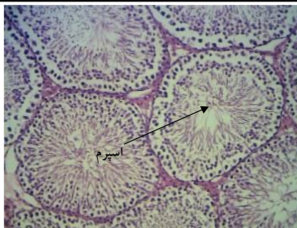
شکل 2- بافت بیضه در گروه دریافت کننده 2000mg/kg گوشت میوه نارگیل (هماتوکسیلین - ائوزین، بزرگنمایی 40x)

بدین وسیله از مسئولان و کارکنان محترم دانشگاه آزاد اسلامی واحد کازرون، دانشکده پزشکی، دامپزشکی و آزمایشگاه تشخیص طبی دکتر قوامی شیراز صمیمانه سپاسگزاری می‌شود.