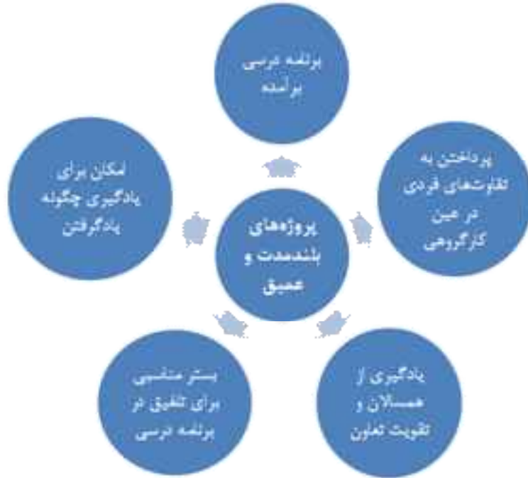
شکل شماره ۵- پروژه‌های بلند مدت و نقش آن‌ها در شکل‌گیری برنامه درسی برآمدنی

به عنوان مثال، در یکی از پروژه‌هایی که کودکان در آن درگیر شدند و آن‌را کارخانه راه بی‌پایان نام نهادند، یکی از کودکان به روابط اجتماعی حاکم در چنین محیطی علاقه بیشتری داشت؛ بنابراین، بازی‌های زیادی ایجاد شد که در آن، هر یک از کودکان نقشی را به عهده گرفتند؛ نقش‌هایی چون رییس، مدیر داخلی، بخش طراحی. درگیری آن کودک با این موضوع باعث شد تا بیشتر در این مورد بدانند. در جلسه‌ای که با اولیاء برگزار شد، پدر این کودک که مدیر یک کارخانه است عنوان می‌کرد که «می‌دیدم مدتی است که پسرم بیشتر راجع به کارخانه می‌پرسد، این که من در کارخانه چه کار می‌کنم؟ چرا من مدیرم؟ آیا کارگرانم از من اطاعت می‌کند و چرا...؟». کودک هر روز بخشی از شنیده‌هایش را به کلاس می‌آورد و شروع به کار می‌کرد. در بسیاری از موارد موضوعات به چالشی گروهی تبدیل می‌شد که کودکان در مورد آن به بحث می‌پرداختند و این خود سبب می‌شد تا دیگران نیز در این رابطه بیشتر بدانند و برای خود نظری داشته باشند. در همین پروژه، موضوعات متنوع دیگری چون ساخت ظروف سفالی، چگونگی تزئین آن‌ها، چطور می‌توان آن‌ها را کاربردی کرد، اجناس چه کیفیت و چه قیمتی داشته باشند و