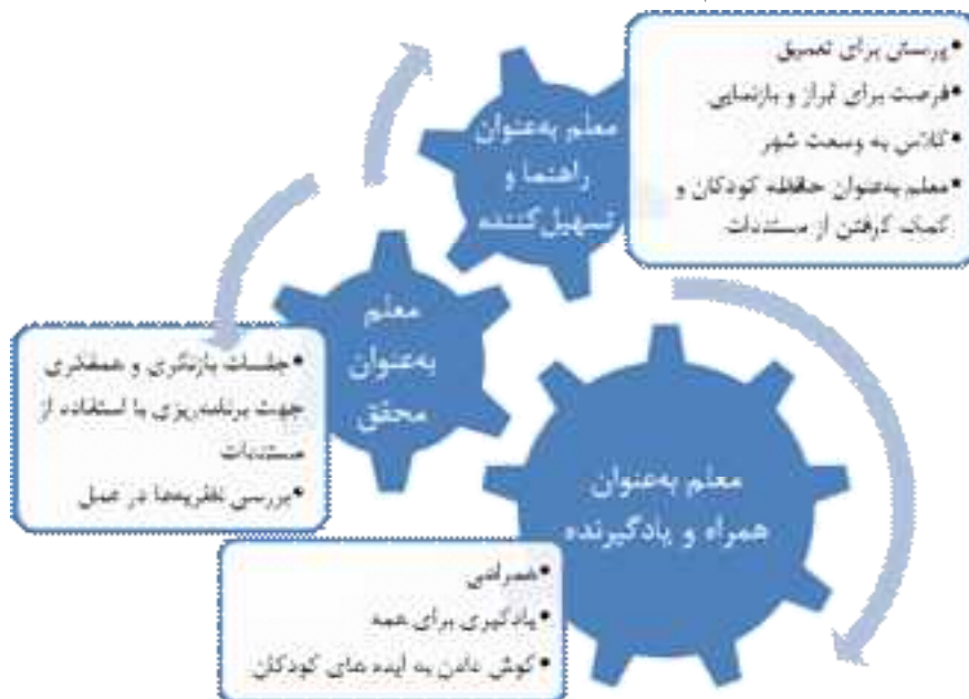
شکل شماره ۱ - نقش معلم در شکل‌گیری برنامه درسی برآمده، همراه شدن با بچه‌ها در فعالیت‌های آن‌ها

یکی از مهم‌ترین قسمت‌ها در نقش معلم، همراهی با کودکان است. همراهی که شکل مصنوعی ندارد و کودکان در کشف دنیا معلم را همراه خود می‌دانند و سعی می‌کنند از او کمک بگیرند و زیبایی‌هایی را که یافته‌اند به او نیز نشان دهند. مثلاً، این احساس بسیار خوبی را به کودکان می‌داد و هم فضای همکاری را در بچه‌ها تشویق می‌کرد، هم باعث می‌شد معلم از نزدیک و در بطن ماجرا بهتر بتواند علاقه‌ها، دغدغه‌ها و یا حتی فهم نادرست کودکان از یک موضوع را مشاهده کرده و این داده‌های عمیق در حمایت و گسترش موضوعات به او کمک کند. گاه این همراهی جلوه صبر به خود می‌گیرد. مثلاً، یکی از کودکان همیشه فقط درباره کارهایی که می‌خواست انجام دهد، سخن می‌گفت ولی دست به انجام کار نمی‌زد. معلم همواره با دقت به صحبت‌های او گوش می‌کرد. کودک در مورد خانه و حیواناتی که در خانه دارد بسیار حرف می‌زد. معلم از او خواست تا با همه بچه‌ها به خانه او بروند. در خانه، او کارهایی را که انجام داده بود