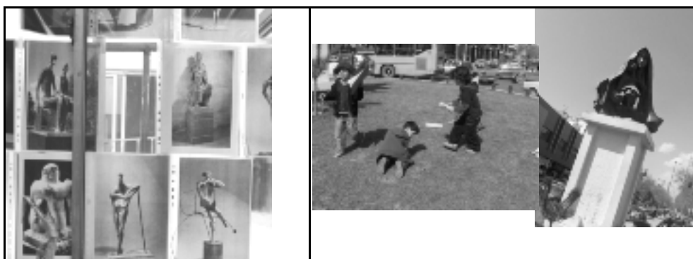
شکل شماره ۳- استفاده از نمونه‌ها و همه شهر به‌عنوان مدرسه

یادآوری و بازنگری فرآیند توسط معلم و مستندات: مستند کردن فعالیت‌های کودکان، نشان دادن مستندات به کودکان و صحبت پیرامون کارها و فعالیت‌هایی که بچه‌ها انجام داده‌اند، به بازبینی و گسترش روند پروژه کمک می‌کرد.