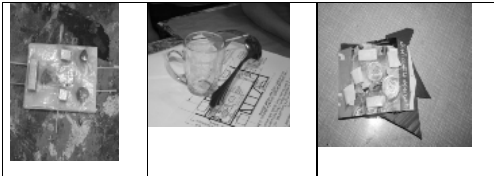
شکل شماره ۷- تجربه‌های مختلف کودکان برای حفظ تعادل

در موارد مختلف ریاضی به کمک کودکان می‌آمد تا موضوعاتشان را حل کنند. مثلاً، در پروژه کارخانه، قیمت‌گذاری روی اجناس، جمع کردن پول‌ها و تقسیم آن‌ها بین اعضای گروه با استفاده از مفاهیم ریاضی انجام شد؛ یا در پروژه مجسمه، فراتر رفتن کودکان از دو بعد به بعد سوم درک آن‌ها را از فضا و حجم به نحو جدی تقویت کرد و آن‌ها به صورت عینی تجربه کردند.