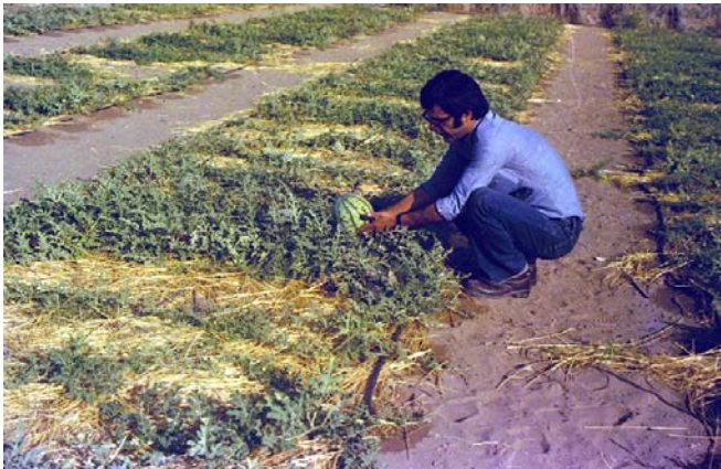
عکس شماره ۳- شروع برداشت محصول هندوانه رقم ژاپنی

آماری مشخص با تعداد تکرارهای لازم امکان‌پذیر نبود. برای مقایسه نتایج حاصل از عملکرد محصولات در تیمارهای مورد آزمایش (وجود یا عدم وجود لایه غیر قابل نفوذ و تیمارهای آبیاری)، طول خطوط کشت هر محصول به ۵ قسمت مساوی تقسیم شد و محصول بدست آمده از هر قسمت به‌عنوان یک تکرار آزمایش در نظر گرفته شد. به‌عبارت دیگر تکرارهای آزمایش در درون تیمارها در نظر گرفته شد بنابراین هر گونه خطای احتمالی در نتایج این تحقیق می‌تواند از انتخاب اجتناب‌ناپذیر این روش آزمون ناشی شده باشد. گرچه آزمون ساده مقایسه میانگین تیمارهای مورد بررسی (برای بیشتر تیمارها اختلاف محصول بسیار زیاد بود) برای این تحقیق می‌توانست گویای یک نتیجه‌گیری نسبی برای تیمارهای برتر باشد، لیکن همان‌گونه که ذکر شد تجزیه واریانس با آزمون F انجام گردید.