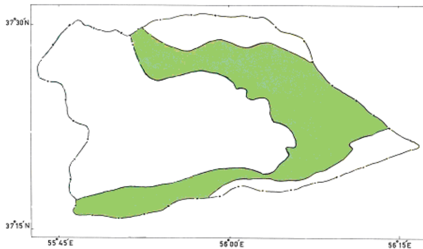
شکل ۱- رویشگاه Hedysarum kopetdaghi در پارک ملی گلستان

Onobrychis sintenisii , Onobrychis cornuta , Astragalus spp., Melica persica , Acantholimon sp., Stachys sp., Elymus repens , Coronilla varia , Hypericum scabrum , Agropyron cristatum , Poa bulbosa , Festuca ovina , Verbascum spp., Artemisia sp., Stipa sp., Zosimia absinthifolia , Dactylis glomerata , Lycium sp., Bromus tomentellus , Ferula sp., Juniperus polycarpus , Eremurus kopetdaghensis , Hedysarum micropterum , Perovskia abrotanoides ,