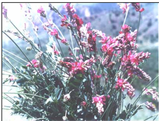
شکل ۵- مرحله تشکیل غلاف Hedysarum kopetdaghi