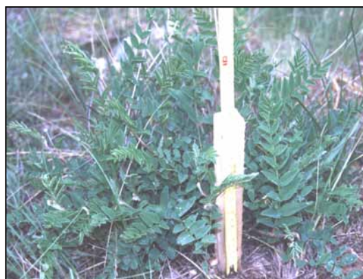
شکل ۳- مرحله ظهور غنچه Hedysarum kopetdaghi

این گونه مرتعی عمدتاً از طریق بذر تجدید حیات می نماید (شکل ۶). بذره‌های ریخته شده در پای بوته‌ها بعد از سپری شدن سرما و معمولاً در اسفند ماه جوانه می زنند. بررسیها نشان داد که بذرهایی که در زیر بوته‌ها قرار می گیرند نسبت به بذرهایی که در فاصله بین بوته‌ها واقع می شوند از شرایط مناسب‌تری برای جوانه زنی برخوردار هستند و درصد بیشتری از آنها جوانه می زند. در واقع بعد از بارندگیهای زمستانی، خاک نرم و مرطوب اطراف گیاه محیط مناسبی برای رشد و نمو بذرها ایجاد می کند. با گرم شدن تدریجی هوا و خشکی تابستان بسیاری از نهالهای جوان خشک شده و از بین می روند که دلیل آن احتمالاً کمبود رطوبت و رقابت نهالهای جدید این گیاه با گیاهانی است که قبلاً استقرار یافته و ریشه‌های عمیق ایجاد کرده اند. با وجود تولید بذر فراوان و جوانه زدن آنها در پای بوته‌ها، تعداد اندکی از نهالها به رشد خود ادامه داده و به گیاه کامل تبدیل می شوند. همچنین با توجه به پایا بودن این گیاه، معمولاً در اواخر بهمن و اوایل اسفندماه جستهای رویشی گیاه فعال شده و شروع به رشد می نمایند.