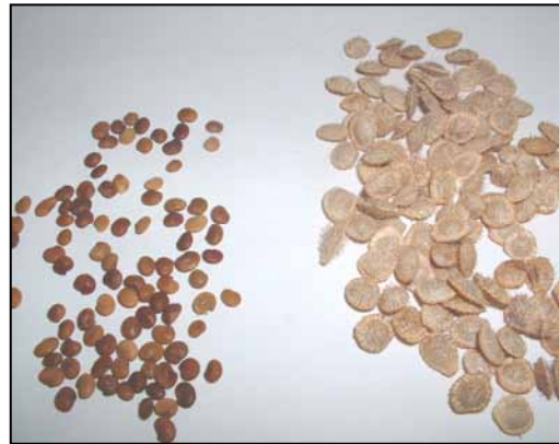
شکل ۶-تجدید حیات Hedysarum kopetdaghi

نتایج حاصل از تجزیه شیمیایی گیاه Hedysarum kopetdaghi نشان داد که میزان پروتئین خام در مرحله رشد رویشی، گلدهی و رسیدن بذر به ترتیب برابر با ۲۷/۷۰، ۲۰/۶۷ و ۱۳/۰۶ درصد بوده که این میزان پروتئین خام برای تغذیه دام قابل ملاحظه می باشد (جدول ۲).