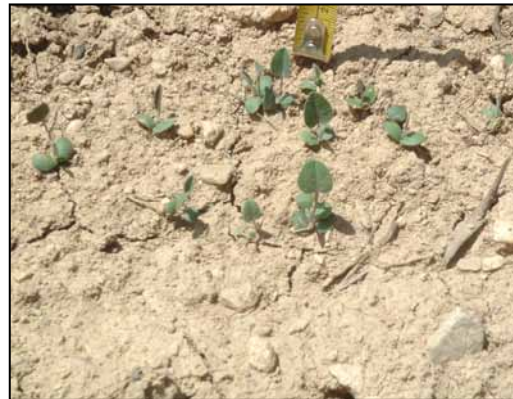
شکل ۷-بذر با غلاف و بدون غلاف Hedysarum kopetdaghi