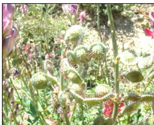
شکل ۴- مرحله گلدهی Hedysarum kopetdaghi