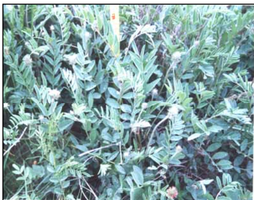
شکل ۲- مرحله رشد رویشی Hedysarum kopetdaghi

این گونه مرتعی عمدتاً از طریق بذر تجدید حیات می نماید (شکل ۶). بذره‌های ریخته شده در پای بوته‌ها بعد از سپری شدن سرما و معمولاً در اسفند ماه جوانه می زنند. بررسیها نشان داد که بذرهایی که در زیر بوته‌ها قرار می گیرند نسبت به بذرهایی که در فاصله بین بوته‌ها واقع می شوند از شرایط مناسب‌تری برای جوانه زنی برخوردار هستند و درصد بیشتری از آنها جوانه می زند. در واقع بعد از بارندگیهای زمستانی، خاک نرم و مرطوب اطراف گیاه محیط مناسبی برای رشد و نمو بذرها ایجاد می کند. با گرم شدن تدریجی هوا و خشکی تابستان بسیاری از نهالهای جوان خشک شده و از بین می روند که دلیل آن احتمالاً کمبود رطوبت و رقابت نهالهای جدید این گیاه با گیاهانی است که قبلاً استقرار یافته و ریشه‌های عمیق ایجاد کرده اند. با وجود تولید بذر فراوان و جوانه زدن آنها در پای بوته‌ها، تعداد اندکی از نهالها به رشد خود ادامه داده و به گیاه کامل تبدیل می شوند. همچنین با توجه به پایا بودن این گیاه، معمولاً در اواخر بهمن و اوایل اسفندماه جستهای رویشی گیاه فعال شده و شروع به رشد می نمایند.