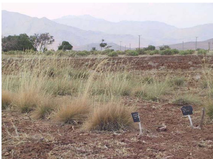
شکل ۳- تصویر گونه Stipa bromoides در خزانه ارزیابی همدان آبرسد (تابلوی سمت راست)