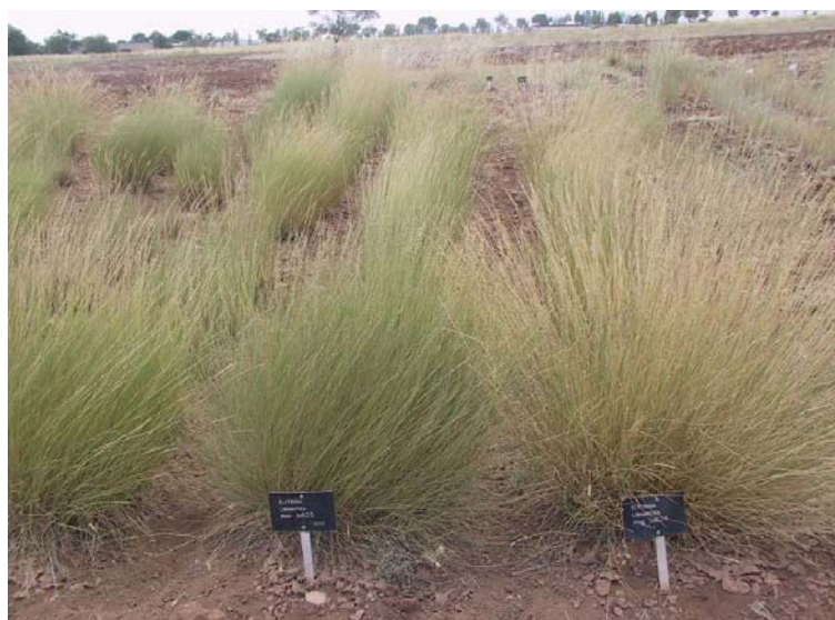
شکل ۲- تصویر گونه Elytrigia libanotica در خزانه ارزیابی همدان آبرسد

آن ۱۲۸ تا ۱۶۹ روز است. میزان تجمع حرارتی در مرحله رشد رویشی در سالهای ۸۲، ۸۳، ۸۴، ۸۵ و ۸۶ به ترتیب برابر ۸۳۳/۳، ۸۳۰/۸، ۸۳۴/۰، ۸۳۲/۰ و ۸۴۶/۳ درجه روز رشد (GDD) بود. مرحله گلدهی آن از ۲۵ تا ۳۱ روز متغیر است و مرحله تشکیل بذر آن بیش از یک ماه طول کشید.