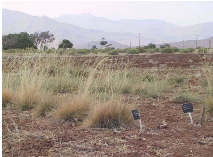
شکل ۴- تصویر گونه Stipa capillata در خزانه ارزیابی همدان آبرسد (تابلوی سمت چپ)

- گونه Stipa capillata : از گندمیان دائمی بوده که در اغلب نقاط ایران و در مراتع کوهستانی پراکنده است (شکل ۴). حداکثر رشد فعال آن از ۱۳۷ روز تا ۱۷۷ روز متغیر است که ۷۵ روز مربوط به مرحله رشد علفی می‌باشد. میزان تجمع حرارتی در مرحله فوق در سالهای ۸۲، ۸۳، ۸۴، ۸۵ و ۸۶ به ترتیب برابر ۸۳۳/۸، ۸۳۱/۸، ۸۳۴/۳، ۸۳۹/۰ و ۸۳۹/۰ درجه روز رشد (GDD) بود. مرحله گلدهی آن در گرم‌ترین سال ۲۳ روز و در