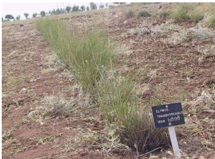
شکل ۱- تصویر گونه Elymus transhyrcanus در خزانه ارزیابی همدان آبرسد

ایران و تورانی پراکنده است. دارای تاج نسبتاً گسترده و قطر یقه بزرگ است که در حفاظت خاک و کنترل فرسایش بسیار مناسب است (شکل ۱). طول دوره مراحل رویشی و زایشی (رشد فعال) ۱۲۷ تا ۱۸۲ روز است. مرحله رشد رویشی آن در مقایسه با سایر گونه‌ها طولانی‌تر است و حدود ۸۰ روز طول کشید (سال ۱۳۸۳). مجموع انرژی گرمایی دریافتی هر مرحله در سالهای بررسی نیز دارای تفاوت اندکی است. طول مرحله رشد علفی بیشتر از بقیه مراحل ثبت گردیده که مقدار آن در سالهای ۸۲، ۸۳، ۸۴، ۸۵ و ۸۶ به ترتیب برابر ۷۲، ۸۰، ۷۸، ۷۰ و ۷۴ روز و میزان تجمع