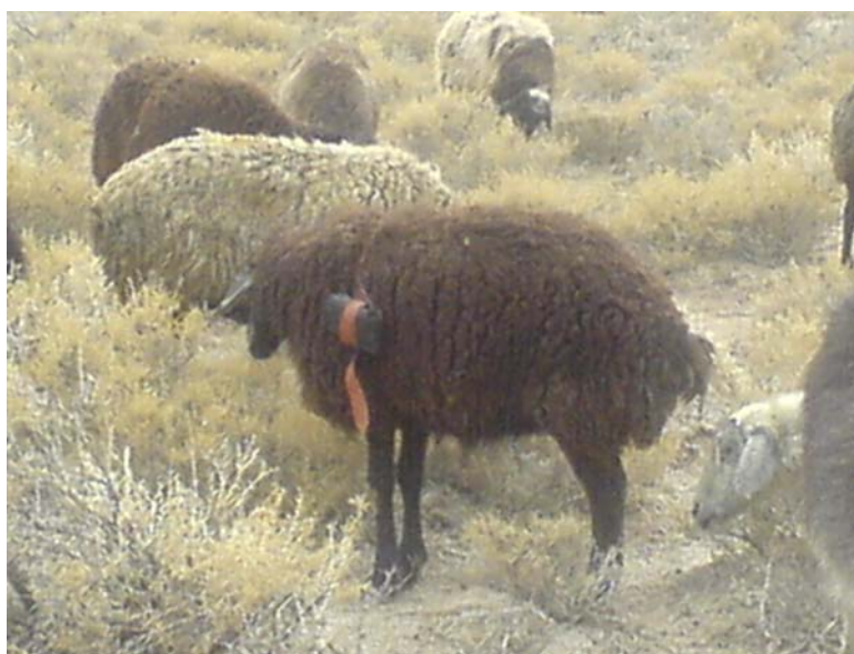
شکل ۲- دام انتخاب شده (میش سه ساله) و نحوه الصاق GPS بر بدن او

ثبت اطلاعات از سیستم تصویر UTM 1 با داتوم ۲ و بیضوی WGS84 ۳ استفاده شد. اطلاعات با استفاده از نرم‌افزار Map source به رایانه منتقل شده و بر نقشه منطقه منطبق گردید. با استفاده از نقشه توپوگرافی یک