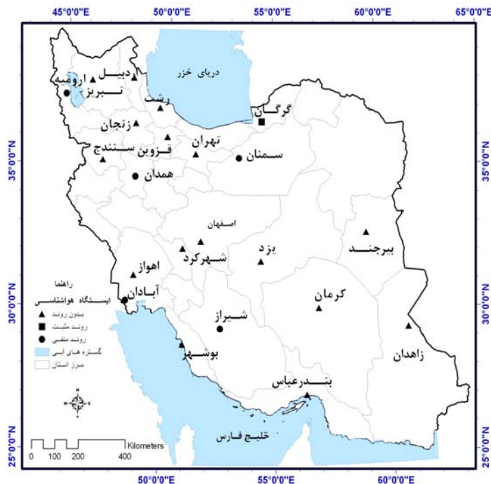
شکل ۱- پراکنش روند در ایستگاه‌های مورد مطالعه در سری زمانی سالانه متغیر نقطه شبیم

نتایج حاصل از بررسی روند متغیرهای مورد مطالعه در سری زمانی سالانه در شکل‌های ۱ و ۲ آمده است.