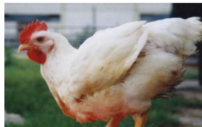
شکل ۲- فنوتیپ خروس‌های تولید شده از تخم مرغ‌های تیمار شده با آنتی آروماتاز