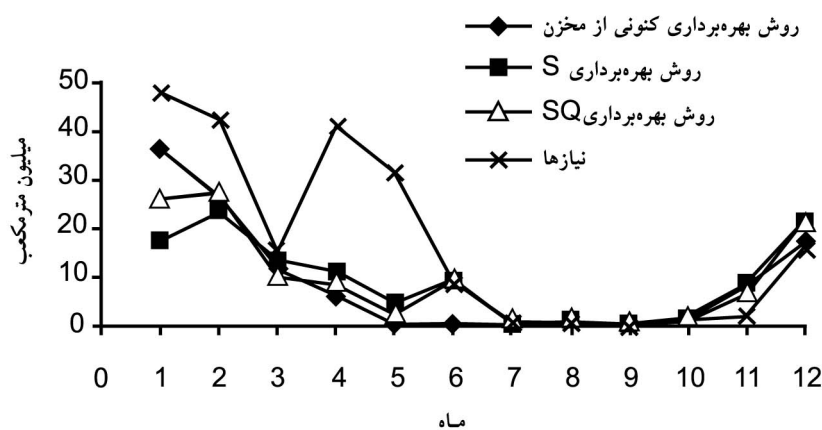
شکل ۲- تخلیه بهینه حاصل از روش‌های S و SQ.

میانگین ذخیره در روش S در حدود ۲۷/۷۳ میلیون متر مکعب در سال می‌باشد که این میزان در روش بهره‌برداری کنونی مخزن به حدود ۱۰ می‌رسد. میزان ذخیره مخزن در روش S و SQ در حدود ۱۷ درصد بیشتر از روش بهره‌برداری کنونی مخزن بدست می‌آید. با توجه به تخلیه‌های صورت گرفته و میزان نیاز، نتایج نشان