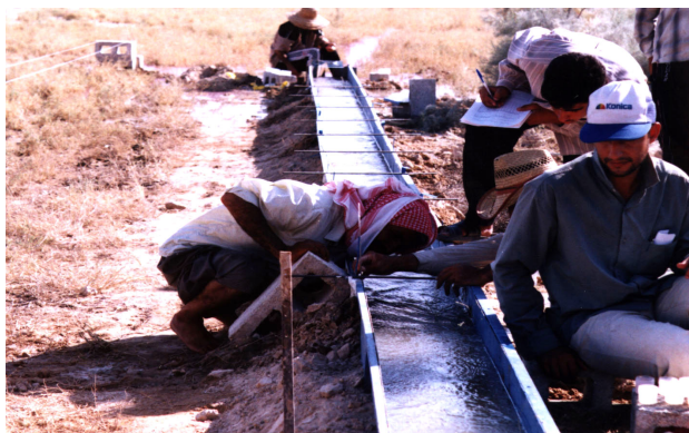
شکل ۲- اندازه‌گیری عمق جریان در مقاطع عرضی متوالی.

پس از تجهیز کارگاه آزمایش‌ها در چهار تیمار مختلف انجام گرفت. تیمارها شامل اراضی جوی دیم همراه با کاه و کلش به ارتفاع ۵ تا ۱۲ سانتی‌متر، مرتع فقیر (درصد تراکم پوشش گیاهی کمتر از ۲۰ درصد)، مرتع متوسط (درصد تراکم بین ۲۰ تا ۴۰ درصد) و مرتع خوب (درصد تراکم بیش از ۴۰ درصد) بودند. در این تحقیق سعی گردید در هر تیمار ۵ آزمایش از دبی کم تا زیاد (۴/۹۵ الی ۲۵/۴ لیتر در ثانیه) درون فلوم تشکیل گردد. شدت جریان در هر آزمایش از طریق پارشال فلوم‌های نصب شده در ابتدا و انتهای فلوم اندازه‌گیری شد و برای اندازه‌گیری عمق جریان از خط کش نوک تیز فلزی استفاده گردید. برای این منظور لبه بالایی دیواره‌های فلوم که به صورت تراز نصب شده بودند به عنوان سطح مبنا انتخاب شده و عمق متوسط جریان برای هر آزمایش در ۹ مقطع عرضی به فاصله یک متر از یکدیگر و در هر مقطع عرضی ۴ نقطه به فاصله ۱۰ سانتی‌متر، در مجموع ۳۶