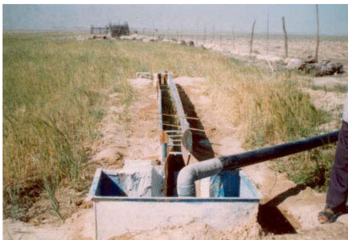
شکل ۱- فلوم، پارشال فلوم و حوضچه آرامش آماده آزمایش.

نقطه اندازه‌گیری شدند (شکل ۲). سپس با اندازه‌گیری مستقیم دبی و عمق متوسط جریان سایر پارامترها از قبیل سرعت متوسط و تنش برشی جریان قابل محاسبه می‌باشند. سرعت متوسط جریان با استفاده از قانون پیوستگی جریان به دست می‌آید: