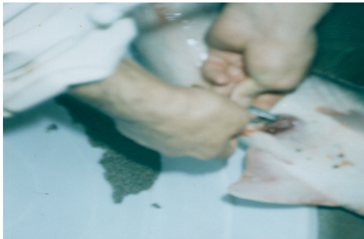
شکل ۱- طرز عمل برش مجرای تخم بر مولدین تاس ماهی ایرانی با استفاده از اسکالپل

برش مجرای تخم بر: عمل برش مجرای تخم بر، براساس روش پادوشکا (۱۹۹۹) صورت گرفت. در این عمل یک نفر بوسیله حوله خشک، شکم و ساقه دمى ماهی را خشک کرده و ظرف مناسبی را جهت جمع‌آوری تخم‌ها نگه داشت، نفر دوم با نگه داشتن ساقه دمى عمل برش را انجام داد، نفر سوم سر و بدن ماهی را در حین عمل برش کنترل کرد و برای راحتی کار نفر چهارم با مالش ملایم