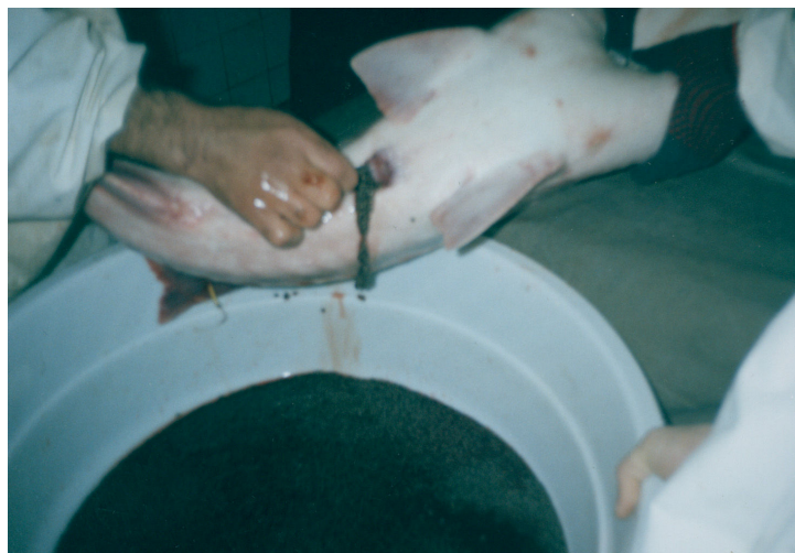
شکل ۲- خارج شدن تخمک‌ها بعد از برش مجرای تخم بر