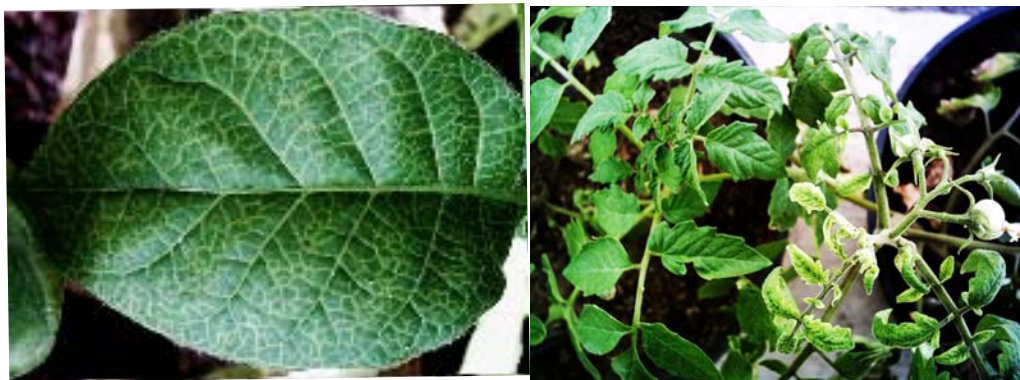
شکل ۵- روشن شدن رگبرگ در اثر مایه‌زنی EMDV در A: N. tabacum var. Turkish و B: در گوجه‌فرنگی.