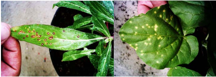
شکل ۳- A: واکنش لکه موضعی نکروتیک در Gomphrena globosa و B: کلروتیک در Nicotiana glutinosa .