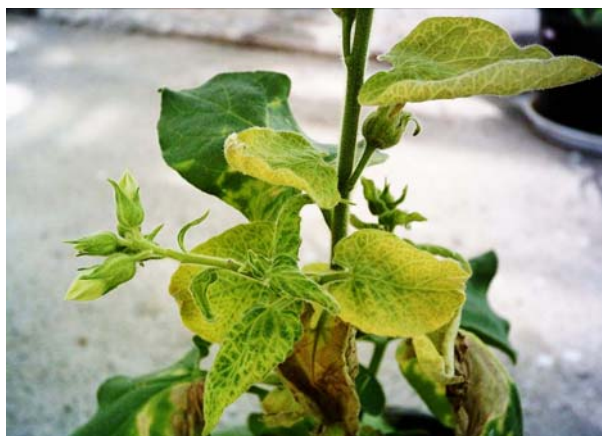
شکل ۶- علائم سیستمیک شدن بیماری در N. glutinosaa در اثر مایه‌زنی ویروس به همراه: A : زردی رگبرگ B : تغییر رنگ برگ‌های قدیمی به دو بخش زرد و سبز.