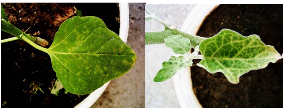
شکل ۷- A : ایجاد لکه کلروتیک در برگ مایه‌زنی شده و B : زردی رگبرگ و سیستمیک شدن بیماری در اثر مایه‌زنی ویروس در بادمجان.

نشان داد که تمامی جدایه‌های شناسایی شده در یک گروه سروژنتیکی و سروتپیی قرار می‌گیرند و از این نظر تفاوتی را نشان ندادند (شکل ۸).