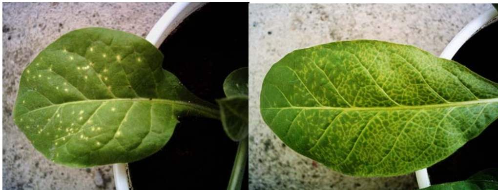
شکل ۴- A: تشکیل لکه کلروتیک درخشنده در برگ مایه‌زنی شده و B: روشن شدن رگبرگ و سیستمیک شدن بیماری در N. tabacum var. Havana .