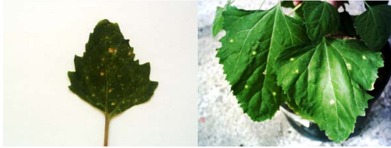
شکل ۲- A و B: واکنش لکه موضعی کلروتیک در برگ Chenopodium quinoa و C. amaranticolor .