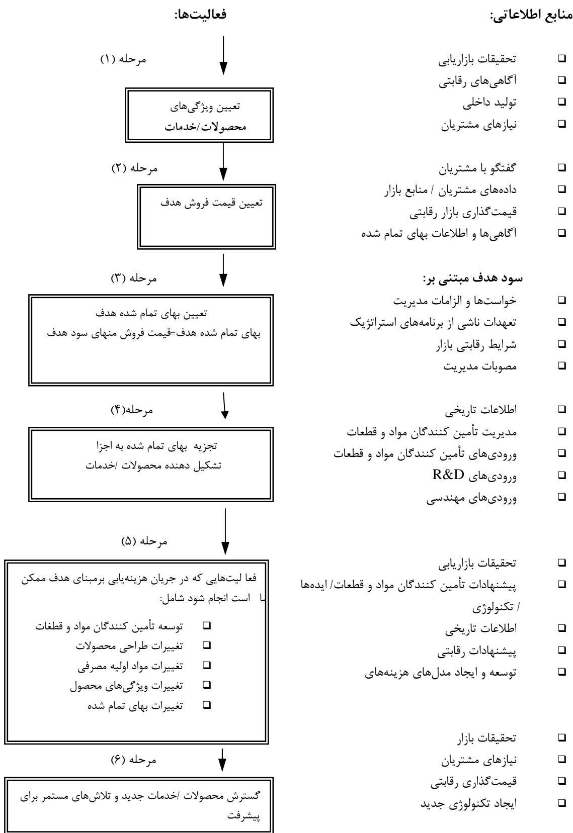
شکل ۳- فرآیند هزینه‌یابی بر مبنای هدف