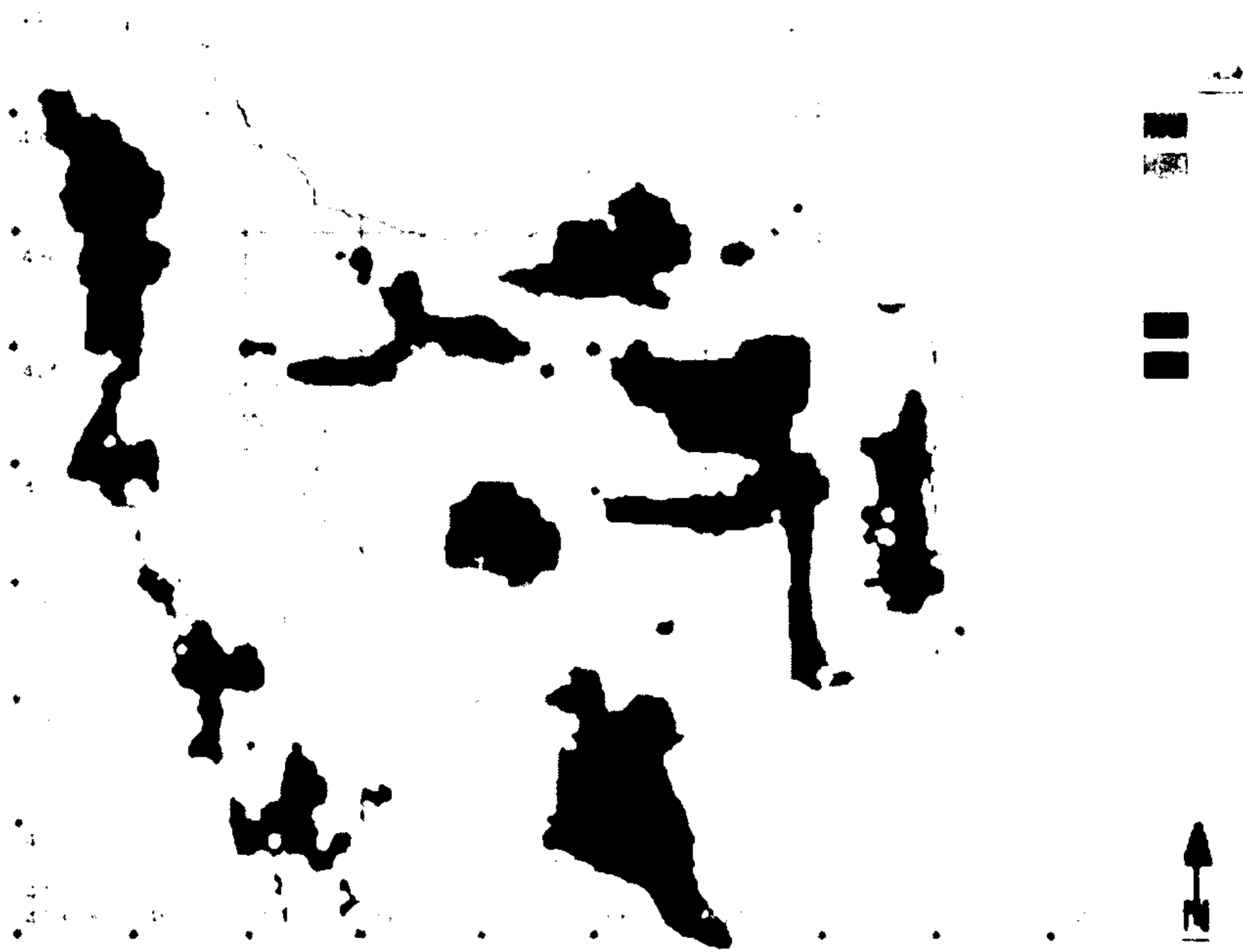
نقشه ۳: پهنه بندی اقلیمی معدوده مطالعاتی در سیستم طبقه بندی ساده سیلیانینف