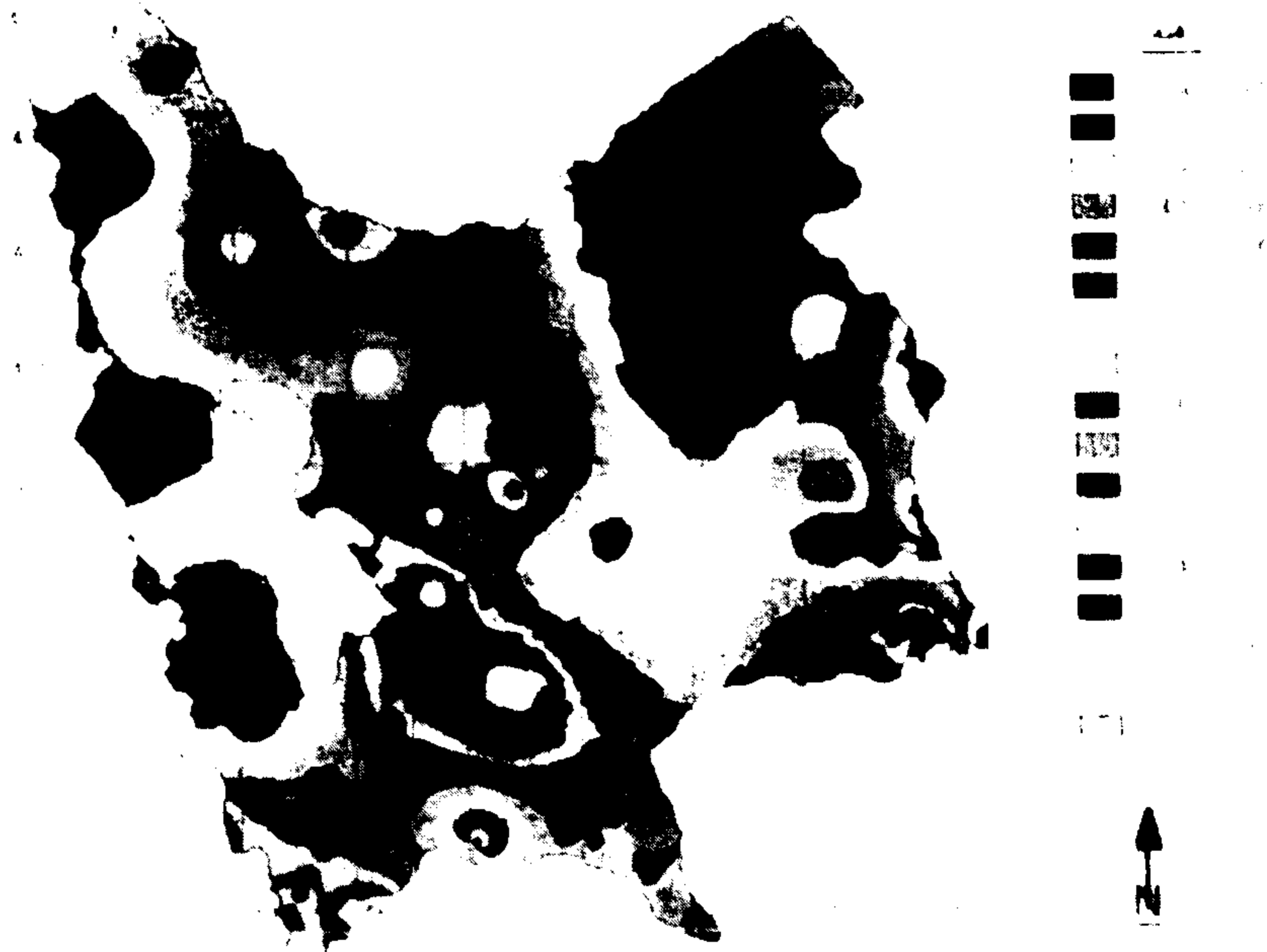
نقشه ۲: توزیع اختلاف بین مقادیر مشاهده شده و محاسبه شده S (درجه روز)

علی خلیلی، علی اصغر درویش صفت، رضا برادران راد و جواد بذرافشان: پیشنهاد روش برای پهنه بندی اقلیمی در محیط GIS مطالعه موردی شمال غرب ایران در سیستم سیلیانینف